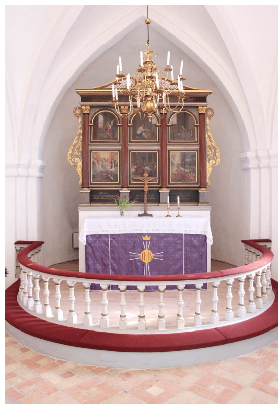
Altaruppsatsen av additionstyp tillverkades på 1500-talet.