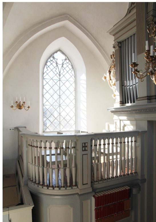
Den södra delen av orgelläktaren från 1913.

Altaruppsatsen är av additionstyp och är placerad på altaret. Uppsatsen tillverkades under sent 1500-tal och består av sex tavlor fördelade på två rader. Sidorna är försedda med förgyllda voluter. Mellan tavlorna står kannelerade kolonner med korintiska kapitäl. Ursprungligen var tavlorna försedda med bibelspråk. De nuvarande målerierna tillkom troligen 1729. Altaruppsat-