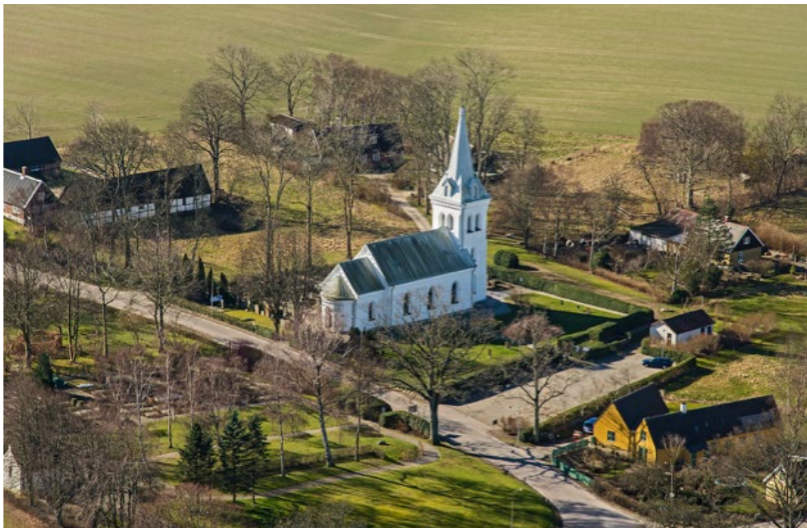
Flygbild över Stångby kyrka tagen nordöst, 2014.

Stångby kyrkby har liksom sin kyrka en historia som sträcker sig tillbaka till romansk tid. Dagens kyrkby är placerad i en vägkorsning med tillfartsleder från öst, väst och söder. Bebyggelsen är samlad kring bygatan och kyrkan, och består av några äldre gårdar och gatehus samt skola och en smedja. Merparten av byggnaderna tillkom under 1800-talet och är uppförda med korsvirkesteknik eller tegel.