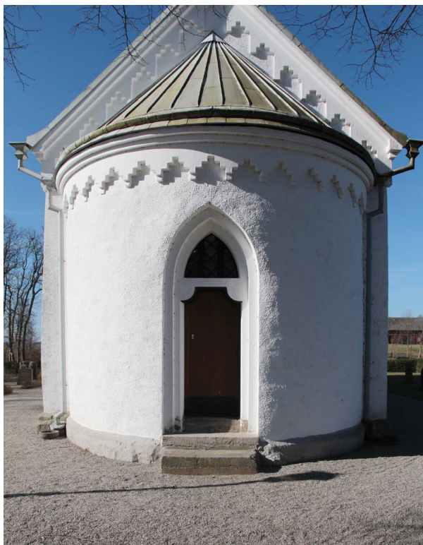
Absiden i öster.