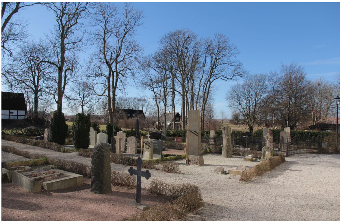
Kyrkogården söder om kyrkan.

1917–19 anlades en ny kyrkogård på andra sidan byvägen. Den nya kyrkogården utvidgades redan 1939. Den södra delen av den nya kyrkogården består av grusade kvarter indelade med låga buxbomshäckar och singelbelagda gångar. Den norra delen är gräsbevuxen med rader av låga, hängande björkar. I söder, öster och väster ramar kyrkogården in av en klippt häck.