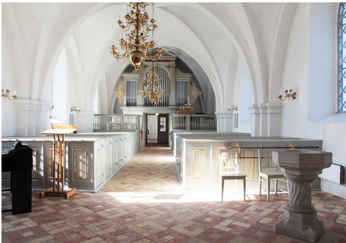
Kyrkorummet sett från öster.