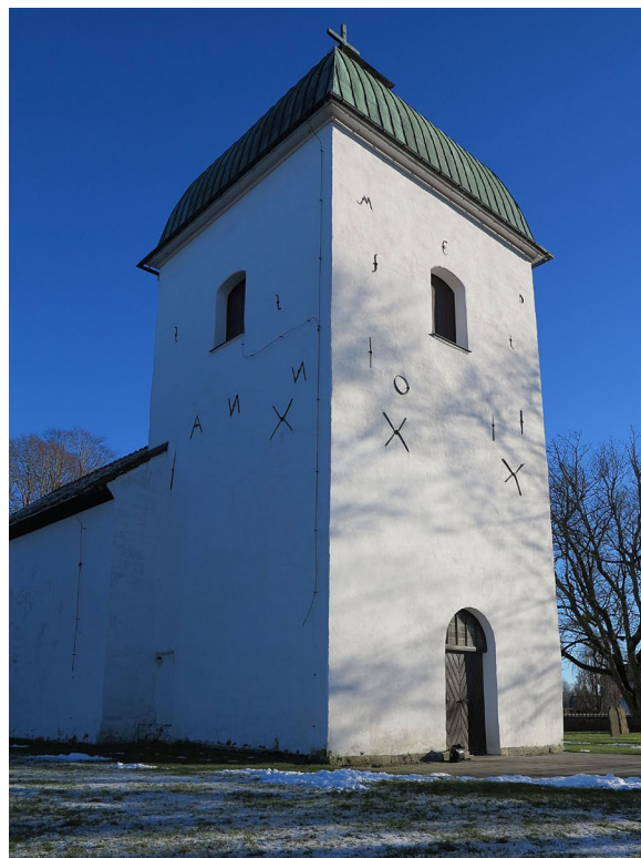
Ankarslutarna på tornfasaderna markerar om- byggnaderna 1400 och 1751.

Sakristian tillkom i början på 1950-talet och har tegelavtäcktt sadeltak som slutar i liv med gavelfasaden åt norr. Över mark består sockeln av otuktad natursten som lagts i liv med fasadputsen. Fönstren är placerade i inramande stickbågiga nischer. I västfasaden sitter en dörr med rombiskt utformade fyllningar.