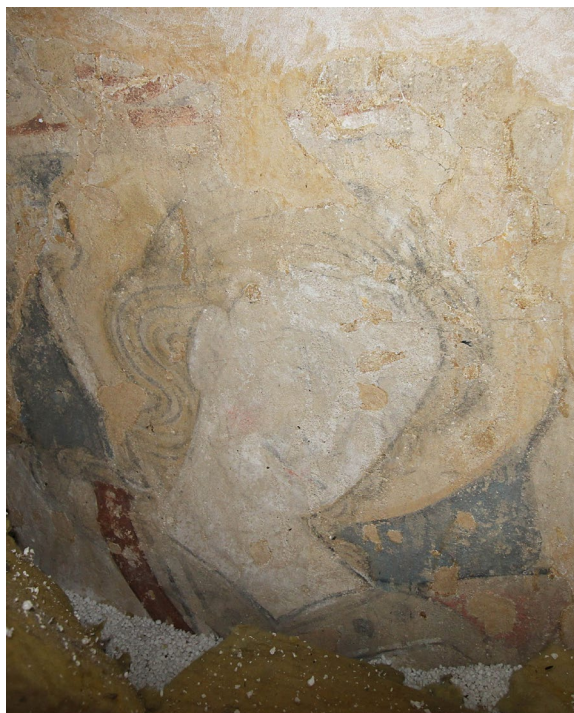
Romansk målning ovan valv föreställande S:t Mikael.

Under den västra delen av koret finns ett gravkor som brukats av patronus på Ellinge åtminstone sedan 1600-talet. Gravkoret täcks av en stor kalkstensskiva.