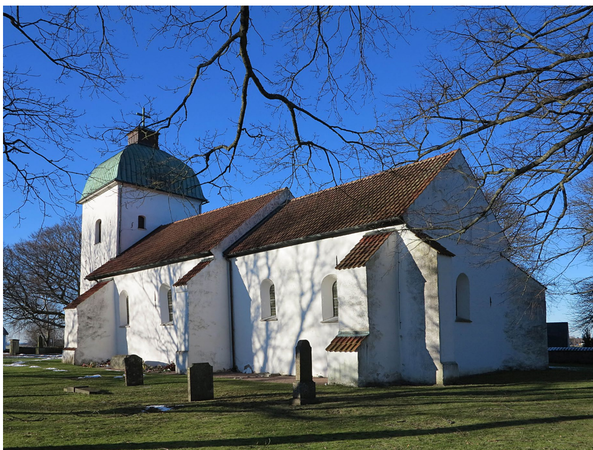
Västra Sallerups kyrka fotograferad från sydost. De kraftiga kontreforerna stöttar långhusets och korets murar.

Tornfasaderna pryds av flertalet dekorativt utformade ankarslutur, vars tekniska funktion är att hålla samman konstruktionen. Ankarslutarna år norr, väster och söder bildas ordet ANNO 1751, och på västfasaden står de romerska siffrorna MDC (1400), båda markerar omfattande ombyggnader av tornet. På den södra fasaden finns ett solur från 1700-talet i kalksten och i den norra fasaden en nisch som markerar en tidigare dörröppning. Klockvåningen har stickbågiga ljudöppningar i samtliga väderstreck.