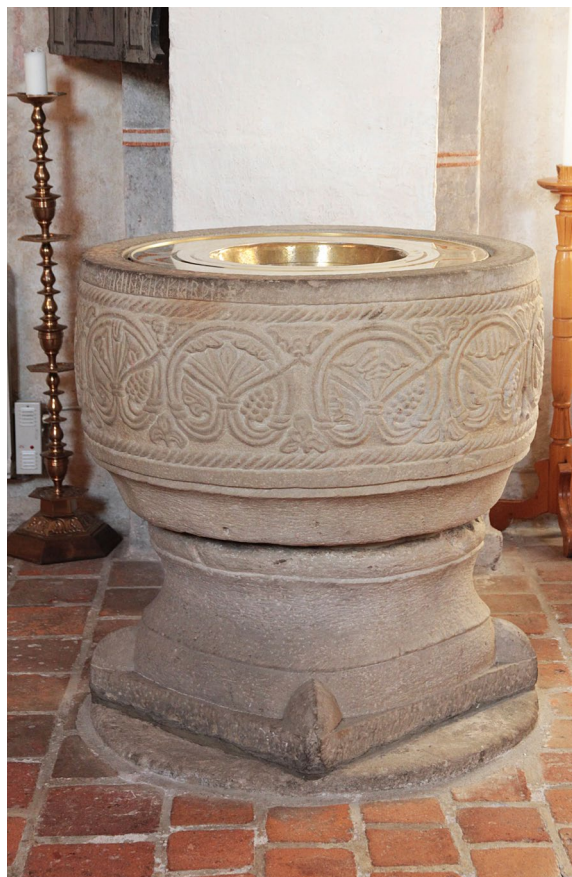
Dopfunten höggs av Mårten stenmästare på 1100-talet.

Dopfunten är placerad vid den mittersta gördelbågens norra sida och tillverkades på 1100-talet i sandsten av den skånske stenhuggaren Mårten stenmästare. Cuppan är dekorerad med palmettmotiv, livsträd och repstav. Överst finns runor med orden ”Martin mik giarde”: ”Mårten gjorde mig”. Foten är kvadratisk med accentuerade hörn och vilar på en cirkulär stenplatta. Dopfunten stod mellan 1891 och 1953 i Eslövs kyrka.