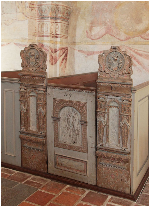
Herrskapsbänkarna i koret snidades på 1600-talet av Jakob Kremberg.

Predikstolen är placerad i långhusets sydöstra hörn och tillverkades i renässansstil av bildhuggaren Jakob Kremberg 1615. Korgen vilar på en snidad kolonn och har fem bildfält föreställande Jesu födelse, korsfästelsen, uppståndelsen, himmelfärden och pingstundret. Bildfälten är det enda som återstår från den ursprungliga korgen sedan predikstolen byggdes om i samband med att den flyttades från Västra Sallerups kyrka till Eslövs kyrka i slutet av 1800-talet. Även baldakinen tillverkades av Jakob Kremberg och är rikt snidad i renässansstil. Fyra av sidorna är dekorerade med adelsvapnen för släkterna Bille, Brok, Gjoe och Krabbe.