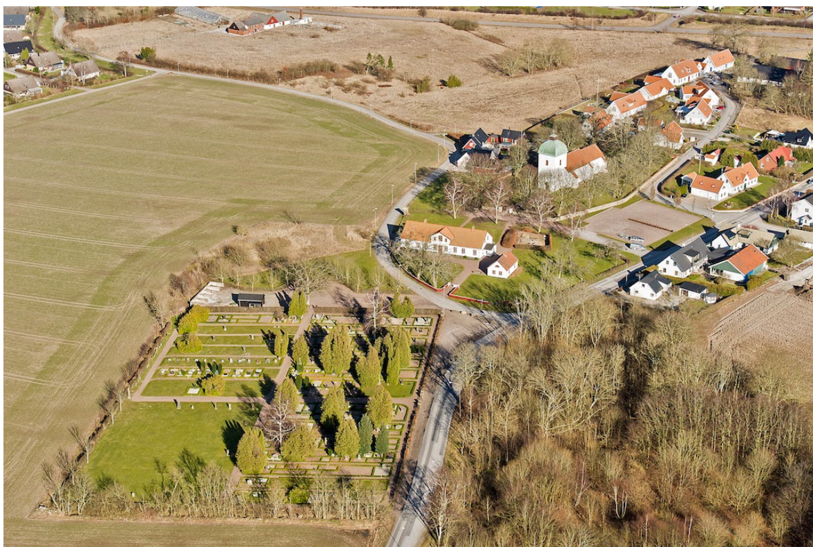
Västra Sallerup med nya kyrkogården i förgrunden strikt indelad av rätvinkliga kvarter.

Den sydvästra delen av kyrkogården utgörs av gräsmatta med ett mindre antal gravvårdar längs den östra sidan. Kyrkogården omgärdas av en formklippt hagtornshäck med ingångar i öster och åt landsvägen som löper längs kyrkogårdens norra sida.