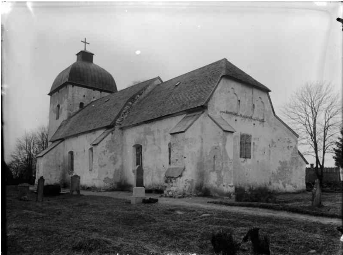
Örtofta kyrka fotograferad från öster någon gång mellan 1904 och 1906. Notera att tornets hörnspiror ännu fanns kvar.

1724 anmäler Wilhelm Bennet vid Ellinge till domkapitlet i Lund att kyrkan är förfallen. Några år efter senare störtar tornet in och raserar långhusets västra valv. I mitten av 1700-talet restaureras kyrkan och 1793 byggs den till norrut med en korsarm i rött tegel för att rymma den växande församlingen. 1797 återuppbyggdes tornets övre del som kröntes med nuvarande tornhuv.