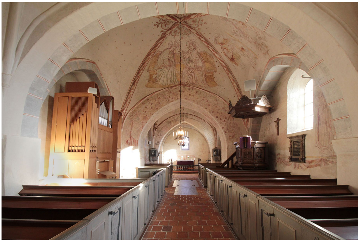
Kyrkorummet sett åt öster.

en ritsning som visar en äldre fönsteröppning. Över ingången från vapsehuset syns den romanska emporkvåningens kolonettgalleri, vilket sattes igen under medeltiden och i mitten av 1400-talet dekorerades med kalkmålningar. I den vänstra arkadbågen återges Sankt Görän och draken och i den mittersta ärkeängeln Mikael. I den högra arkadbågen återfinns ett odjur om räcker ut tungan.