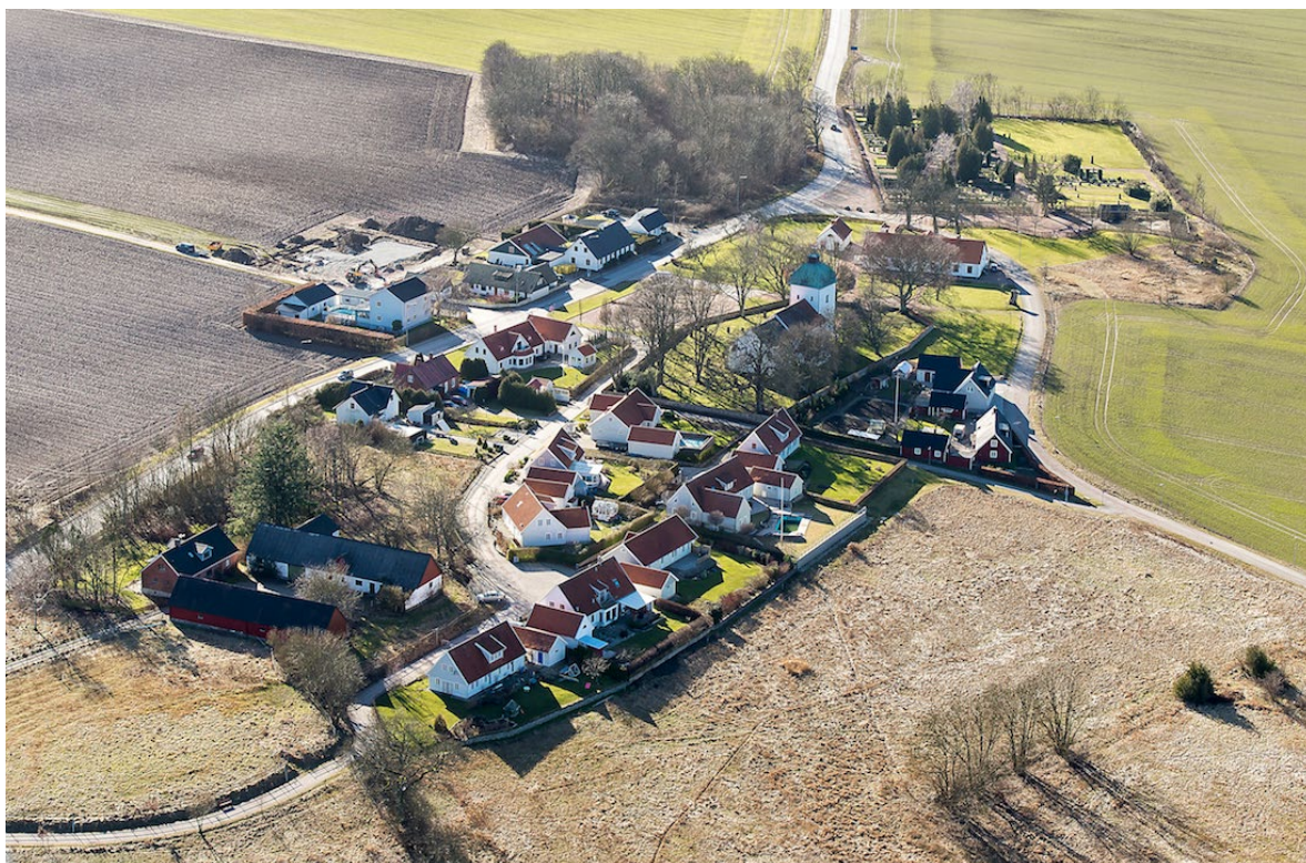
Flygbild över Västra Sallerup tagen från öster, 2014.

Redan i samband med de så kallade bygdestriderna på 400-talet lär Saxulftorp ha blivit en radby. Gårdarna i Västra Sallerups socken kom från 1000-talet successivt att