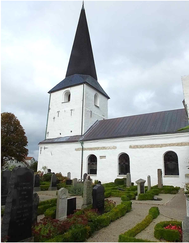
Kyrkans västra del sedd från söder.