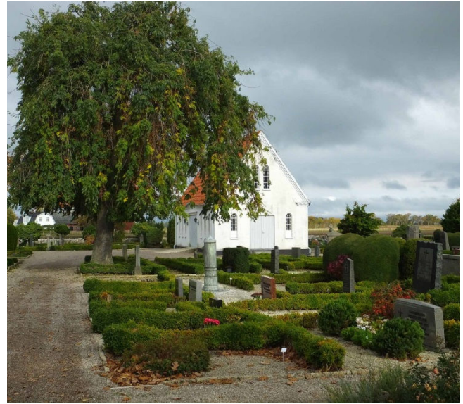
Kyrkogårdens äldsta delar har en rik gravkultur. Till höger syns gravkapellet.