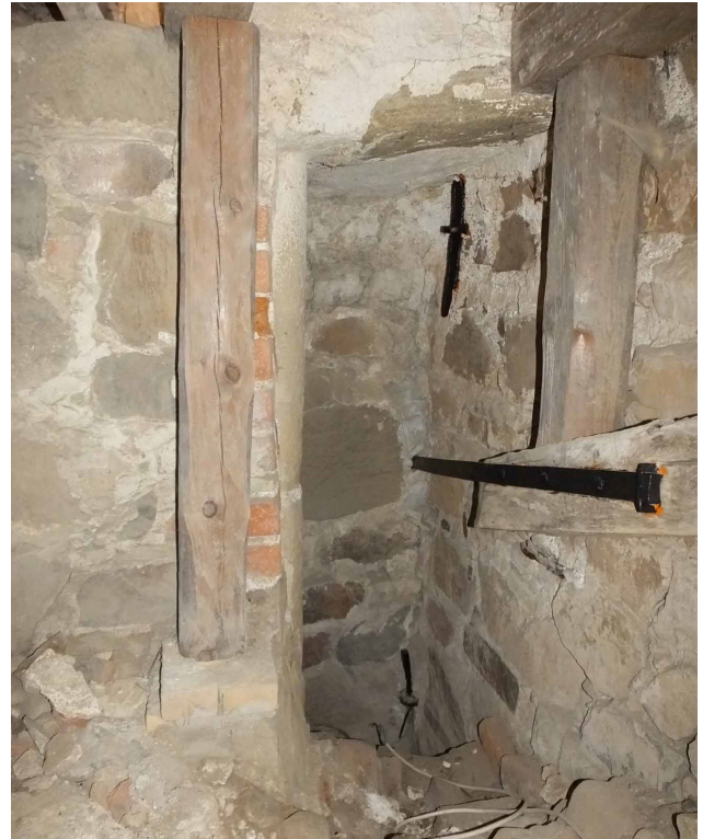
Tornets bottenvåning är kyrkans vapenhus. Här finns uppgång till läktare och tornets övre våningar. Till höger syns den gamla ingången till tornets andra våning.

är uppbyggd av en kymantionfris, rundbågsformade fyllningar och profilerat listverk. Läktaren är målad i grått med detaljer i rött, vitt, blått och guld. Kyrkans nuvarande orgel utfördes 1965 och placerades i norra korsarmen. Den gamla orgelns fasad finns bevarad på långhusets orgelläktare.