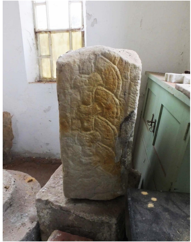
En ovanlig form av romansk gravsten har hittats på kyrkogården med en huggen dekor i form av en ringkedja.