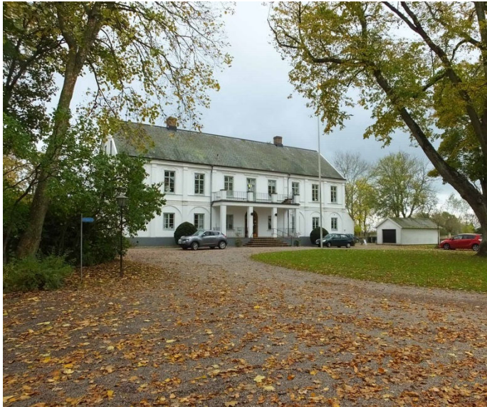
Prästgården i Väsby.