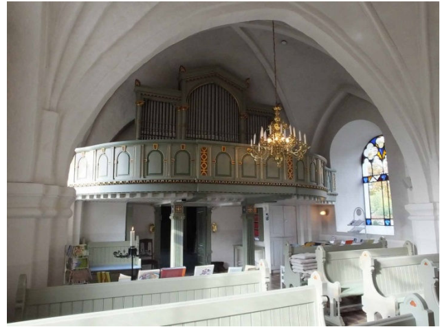
Till vänster visas kyrkorummet sett mot norra korsarmen och till vänster långhuset mot väster.

Kyrkans samtliga delar, utom sakristian, täcks av valv av olika ålder. I långhuset finns ett kryssvalv längst i väster och två stjärnvalv. Stjärnvalven kan dateras till omkring 1430 och möjligen är det västra kryssvalvet slaget vid samma tid. Valven är slagna med sköldbågar och valvribborna utgår från kolonetter uppburna av tresprångiga pilastrar med profilerade kragband. Kryssvalvet har firsidiga ribbor medan det västra stjärnvalvet har dels kvadratiska och dels tresidigt profilerade ribbor. Det östra stjärnvalvet har treklöverprofilerade ribbor. I ribbornas skärningspunkter finns runda valvkappar. Över korsmitten finns ett gratkryssvalv där valvkapporna möts i spetsig vinkel utan valvribbor. Mellan långhuset och korsmitten finns ett smalt välvt parti vilket närmast har formen av ett spetsbågigt tunnvalv. Korsarmarna och koret täcks av vardera två kryssvalv. Valvet i norra korsarmen är från 1560-talets början och korvalven kan vara från samma tid. Södra korsarmens valv är från 1819 då även valven i korsmitten tillkommer. Korsarmarnas och korets valv utgår från murarna och ribborna har firsidig genomskärning. Sköldbågar finns endast på västra korvalvet.