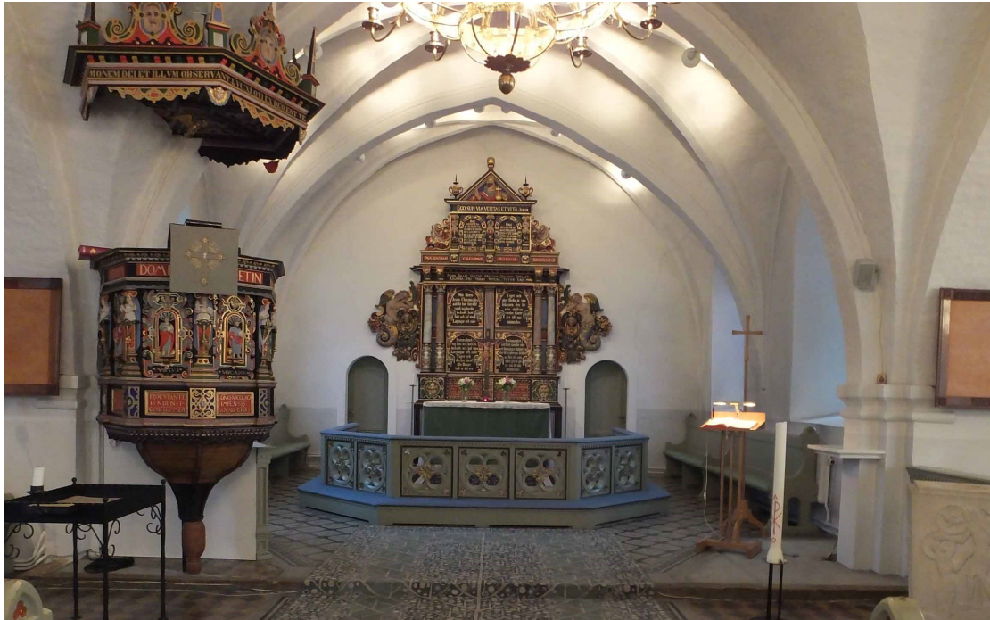
Koret sett från långhuset.

Tornets övre våningar nås från ingången i tornets tunnvalv. Andra våningsplan består av ett lågt utrymme mellan tunnvalvets ovansida och ett senare träbjälklag med trägolv. Tunnvalvets ovansida är delvis täckt med tegel. I sidomurarna syns trapploppen till tornets ursprungliga uppgångar. Södra murens spindeltrappa är delvis bevarad med spindel av huggen sandsten och steg av tegel. Trappan i norra muren till tredje våningen har både spindel och steg av tegel. Ett par ursprungliga gluggar murade av sandsten med djupt skrånande smygar finns i södra muren. Ovanpå bjälklaget med brädgolvet står ett gammalt mekaniskt urverk till tornuret. En trätrappa leder vidare till klockvåningen. Andra våningen täcks av ett tunnvalv av sandsten likt första våningen. På detta ligger ett golv av kullersten och däröver finns ett bjälklag som bär upp klockvåningen och en klockstol av ek från 1786. Tornspiran är utförd av fur med kungsstolpe av ek.