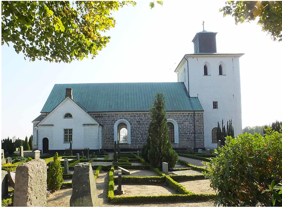
Kyrkan sett från norr. Vid kyrkans norra sida finns sakristian från 1926.

och ett senmedeltida kalkmåleri i långhus och kor någon gång under 1400-talet. Huvudingång till kyrkan var via ett vapenhus utanför långhusets sydportal. För att få bättre ljus till kyrkans västra del gjordes en fönsteröppning i tornets norra sida år 1804. År 1818-20 byggdes tornet om efter ritningar av Carl Gustaf Blom Carlsson. Före ombyggnaden hade tornet murade trappgavlar mot öster och väster med blinderingar i gavelkrönen. Vid ombyggnaden revs gavlarna och tornets övre mur byggdes på med cirka en meter och erhöll det nuvarande lanternintaket. Det utvändiga trapptornet revs och vapenhuset revs också. En befintlig ingång i tornets västra sida gjordes om och förstorades och ny invändig trappuppgång gjordes till tornets övre våningar. Rivningsvirke från vapenhuset återanvändes till den nya trappan i tornet. Invändigt var kyrkan möblerad med bänkar ända in i tornet vid denna tid och längst i väster fanns en läktare med två uppgångar längs västra sidan. En runt fönster sattes in i till bottenvåningen i tornets västra sida.