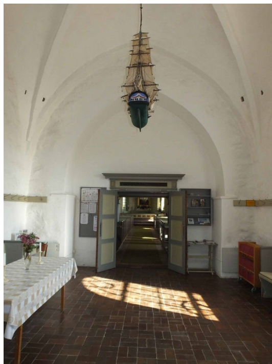
Långhuset och vapenhuset sett mot koret.

Långhuset upptas till största delen av bänkinredningen i två bänkkvarter med mittgång emellan. Golvet är lagt av röda tegelplattor och bänkkvarteren av brädor. I västra delen av långhuset finns en orgelläktare med uppgång från två trappor intill västra långhussidan. Orgelläktaren bärs upp av 14 åttasidiga pelare med skaftring och kapital. Läktarbarriären är utförd med långsmala fyllningar. Läktare liksom orgelfasaden och bänkinredning är målade i grått, grönt, rosa och guld en färgsättning som togs fram av arkitekt G. Widmark 1949. Kyrkorummet är valvslaget med breda och relativt flacka kryssvalv, putsade och vitmålade. Gördel- och sköldbågar är rundbågigt formade och valvbågar och ribbor har fyrsidigt tvärsnitt. Valvpelarna är flersprångiga med kragband av tre utkragande murskift.