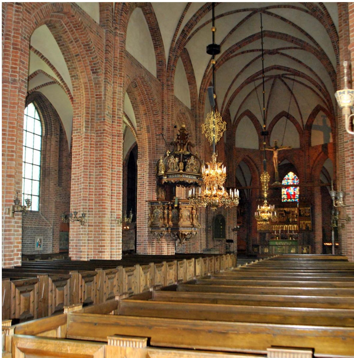
[3]: Kyrkorummet mot koret och norra sidoskeppet