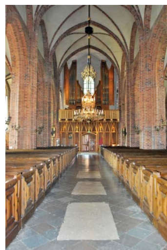
[5]: Långhuset mot orgelläktaren

Sakristiautbyggnaden från 1953 nås från en spetsbågigt täckt, slät och brunmålad trädörr i norra sidoskeppets norra mur. Sakristian är byggd efter sin medeltida förlaga med kalkstensgolv, väggar av tegel och spetsbågigt, kryssvälvt tak. Från sakristians hall nås en toalett och en trappa till källaren med personalrummet och silverkammaren.