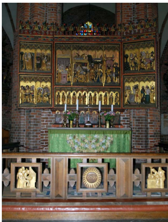
[6]: Altare, altarring och altarskåp

diamantrusticerade ständare, en rak, oklädd överliggare och skinnklätt knäfall. Mellan ständarna sitter fyrkantiga trätavlor med förgyllda reliefer gjorda av Hugo Gehlin.