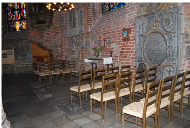
[4]: Kapellet i koromgången, glas- och kalkmålningar

Koret är upphöjt tre steg från långhuset och nås via en granittrappa. Korgolvet är av kalksten. I korets mitt står huvudaltaret och altarskåpet framför ett altarkapell [4] i koromgångens östra del. På kapellväggarna syns två kalkmålningensfragment från sent 1400-tal/ 1500-tal, det ena med en bild av S:t Magnus, S:t Brandanus och S:t Jacob, det andra med ett oklart motiv. Enligt Per Beskow kan avbildandet av helgonen visa på ett skotskt inflytande i staden vid tiden. Upphovsmannen till målningarna tros vara Helsingborgsmästaren. I koromgångens murverk märks fyra sakramentsnischer, som lär ha haft trädörrar under medeltiden, och i sydöstra hörnet resterna av en piscina.