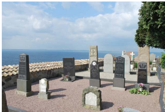
Gamla kyrkogården på kyrkans södra sida.

Många av titlarna på gravstenarna minner om sjöfarten, som skeppare och om närheten till havet, fyrmästare och kustuppsyningsman. Lantbrukare är en vanlig titel, däremot är den stora tegelindustrin inte så synlig på stenarna. Bland ovanliga titlar märks ”de dövstumma systrarna”.