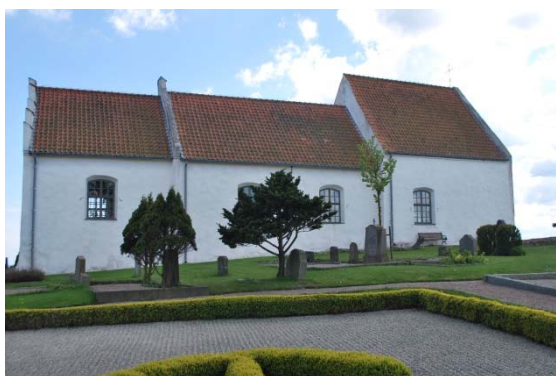
Kyrkan från norr.

Kyrkan är troligen byggd på kallmurar av natursten. Grundstenar är synliga utanför fasadlivet på flera ställen. Ytterväggarna är skalmurar, huvudsakligen av kluven gråsten. Det finns inslag av tegel runt muröppningar och gavelrösten. Ett parti skiljer sig från övriga murar, murverket i långhusets södra mur, i övergången mellan långhusets smalare och bredare del. Denna mur är uppbyggd av sandsten och gråsten och är den äldsta muren. Murarna är slätputsade och putsen är slevdragen, murverkets ojämnheter syns tydligt.