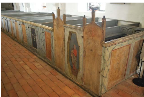
Bänkarna med Brahebänkarna längst fram.

Dopfuntens baldakin är av figursågad ek från 1600-talet.