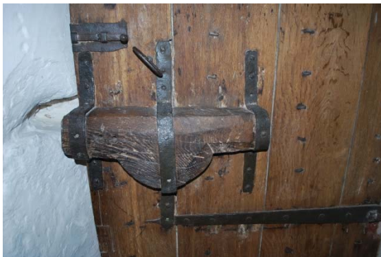
Lås på dörr mellan vapenhus och långhus.