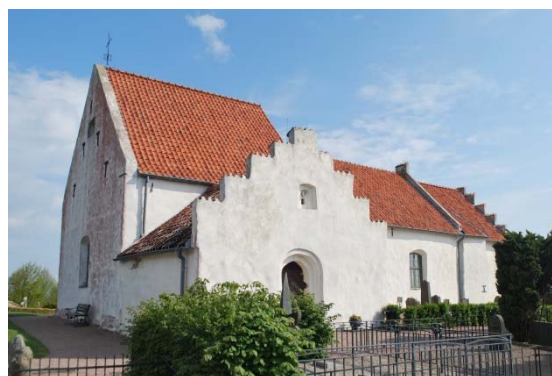
Kyrkan från sydväst.

Kyrkans huvudingång är genom vapenhuset i söder genom en rundbågig öppning med två språng. Dörren är en bräddörr klädd med tjärad panel. Dörren har kraftiga