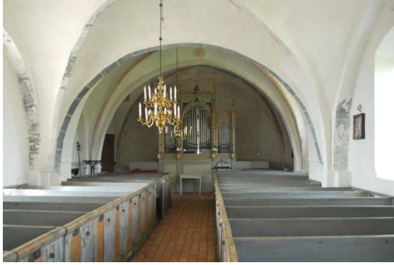
Långhuset sett mot orgeln i väster.