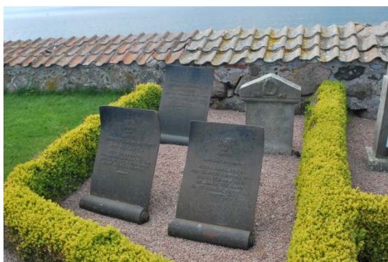
Gravstenar av järnplåt.

Många av titlarna på gravstenarna minner om sjöfarten, som skeppare och om närheten till havet, fyrmästare och kustuppsyningsman. Lantbrukare är en vanlig titel, däremot är den stora tegelindustrin inte så synlig på stenarna. Bland ovanliga titlar märks ”de dövstumma systrarna”.