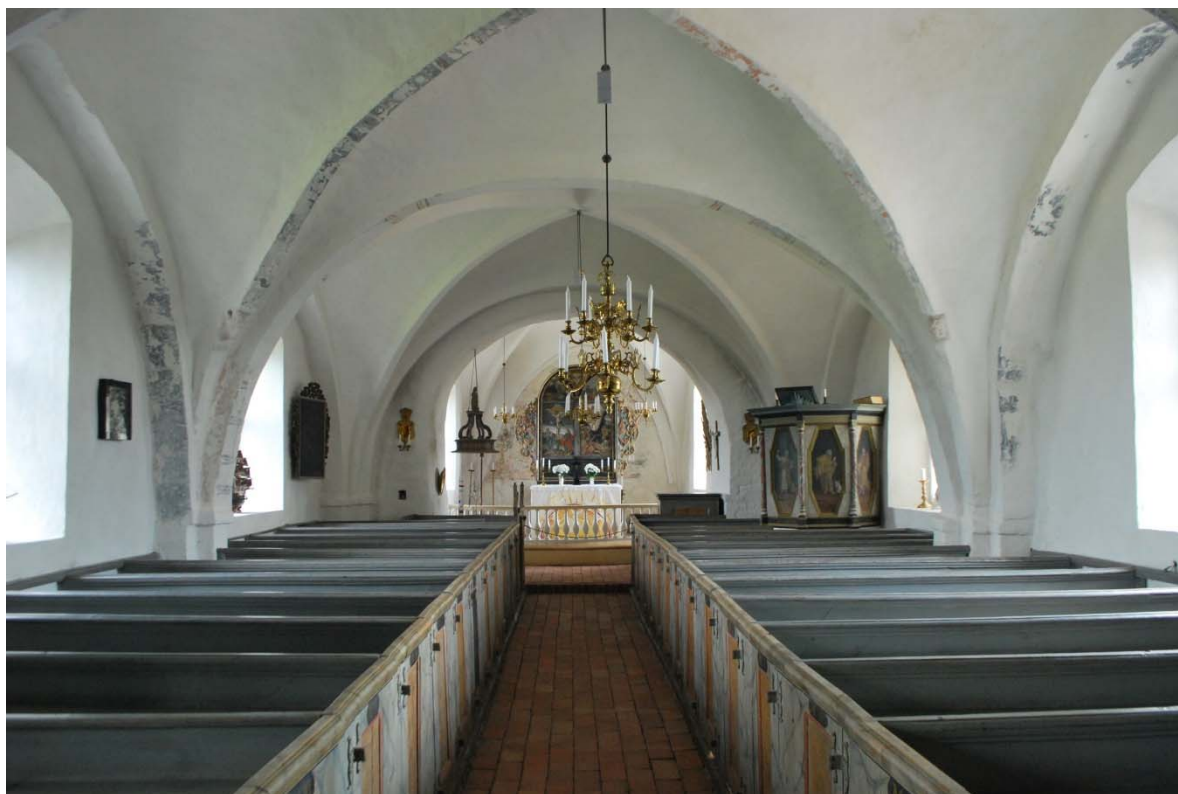
Långhuset sett mot koret.

till väggen. De två västra högre valven har kalkmålningar av grå och röda band och cirklar. Det tredje lägre valvet är dekorerat med skulpterade figurer, bland annat ett vådurshuvud och fragment av kalkmålningar. Ett konsekrationsskors, invigningsskors, är målat på söderväggen. De tre västliga valven slogs på 1400-talet medan det östra i långhuset och valvet i koret murades upp på 1930-talet och ersatte brädvalv.