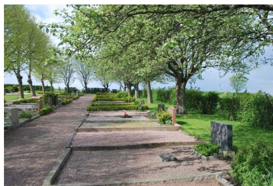
Nya kyrkogården med lindträd och oxelträd.