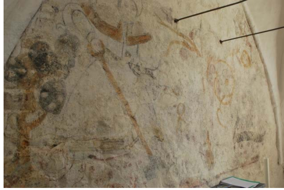
Kalkmålning på korets östvägg bakom altartavlan.