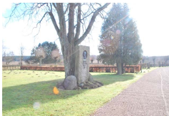
[9]: Gummessons grav, vy mot söder