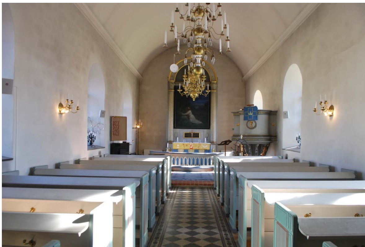
[5]: Långhuset mot koret

Koret [5] är utformat som en integrerad del av kyrkorummet, avskilt från långhuset endast genom ett trappsteg i tegel. Golvet är täckt med tegel lagt på flatan. På korets södra sida finns predikstolen, medan dopfunt och piano står längs norra ytterväggen. I korets centrum finns altaret med altaruppsats och en altarring framför, förhöjd ett steg från korgolvet. Altarrundens golv är beklätt med heltäckningsmatta.