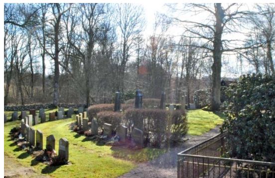
[9]: Urnlund och omgivning

Urnlunden [9] är utformad med gravvårdarna placerade längs ett antal regelbundna halvcirklar. Gravvårdarna är generellt låga med låg växtlighet, ofta städsegröna växter. Den lilla minneslunden består av en mandelformad vattenspegel med en minnessten i dess mitt. Längs kanten står enkla ljus- och blomsterhållare.