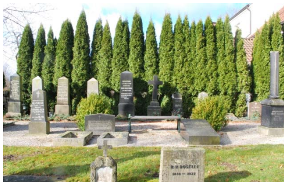
[8]: Hallenborgs familjegrav

och saknar synliga avgränsningar och ofta även plantering. Bland vårdarna dominerar höga, strama granitstenar, som blev vanliga kring förra sekelskiftet. Släkten Hallenborgs familjegravplats [8], är speciellt enhetlig med obeliskliknande vårdar med brutna toppar resta mot en rygghäck av tujor. Flertalet titlar är knutna till jordbruket och de administrativa yrken som kan kopplas till Röstångas framväxt som stationssamhälle.