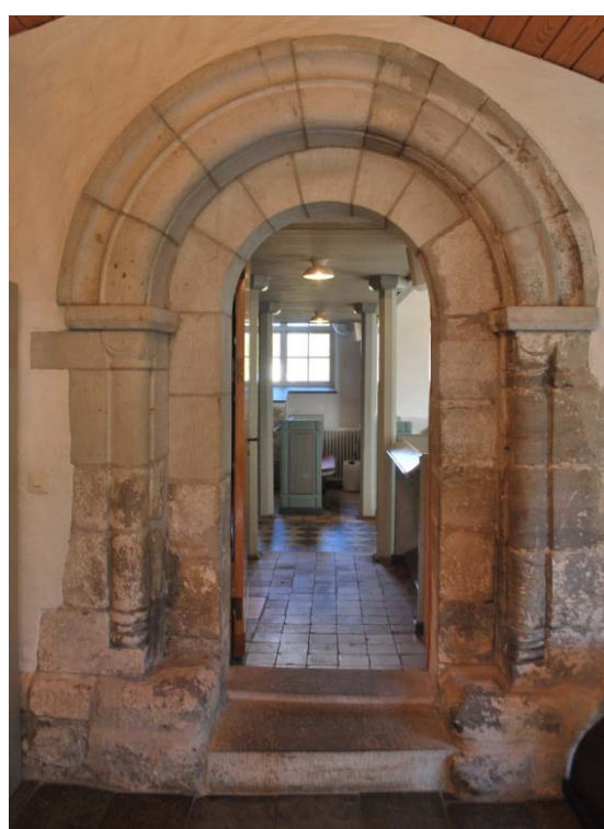
[4]: Den rekonstruerade sydportalen från sakristian

Långhusets gångar är täckta med viktoriaplattor, lagda i ett schackrutigt mönster med geometriska kantbårder, medan de öppna bänkarna står på ett golv av fyrkantiga, gula klinkerplattor. Vid södra sidan finns ett uppehåll i bänkraderna för en tvärgång, som leder till sakristian. Långhusets väggar och innertak, ett stickbågigt tunnvalv i trä, är putsade och vitmålade. Övergången mellan vägg och tak markeras av en putsad gesims med hålkäl och rundstavsprofil. I taket hänger två flerarmade ljuskronor av mässing.