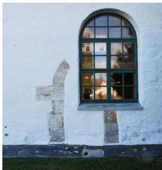
[2]: Gamla nordportalens omfattning

Samtliga tak är sadeltak täckta med enkupigt falstaktegel. Tornets och långhusets pannor kommer från Minnesberg, de yngre pannorna över sakristian från Veberöd. Avvattningen är av brunmålad plåt. Långhusets takfot är inklädd med svartmålade bräder, medan tornets takfotsgesims är av vitputsat tegel i tre utkragande skift.