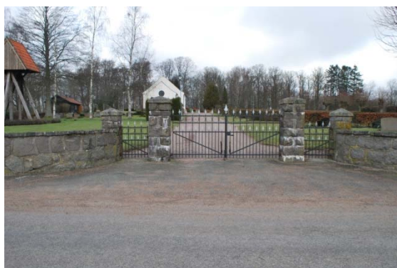
[10]: Nya kyrkogården mot norr

Vegetationen domineras av stora, grästäckta ytor och rygghäckarna, fränsett ett antal träd spridda över kyrkogården. Längs den västra och södra kanten av kyrkogården finns rader av lindar, och längs huvudgången i nordsydlig riktning kraftigt beskurna pelaralmar. På de enskilda gravplatserna finns en stor spännvidd av växter med olika typer av blommor och städsegröna växter.