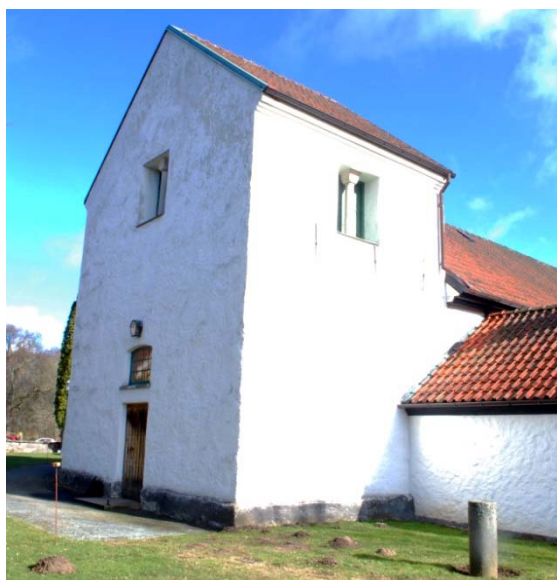
[1]: Tornet och sakristian från sydväst

Kyrkan har tre entréer, huvudentrén genom tornet i väster och sekundära ingångar genom sakristian och koret. Tornportalen består av en raktäckt muröppning med en ramverksdörr utvändigt klädd med lackad panel. Sakristians dörr ser ut på samma sätt, medan korets dörr är utvändigt klädd med grågrönmålad pärlspont i fiskbensmönster. I norrfasaden syns spår av den ursprungliga nordportalen i form av sandstenskvadrar [2]. Långhusets, korets och tornets fönsteröppningar är rundbågiga, enkelsprångiga och slätputsade. Fönsterbågarna är av grågrönmålat trä med fem spröjsade tvåglas lufter, de undre rektangulära och den översta halvcirkulär. Solbänkarna är avtäckta med gråmålade betongplattor, medan de invändiga fönsterbänkarna består av kalkstensskivor. Ovanför torn- och korportarna finns överljus med likartad utformning. Sakristians fönster är rakslutna och består av två lufter kopplade träbågar. I tornet finns rektangulära ljudöppningar i söder, väster och norr försedda med träluckor, utvändigt klädda med grågrönmålad pärlspont. Framför luckorna i mitten av varje öppning står en kolonnett av gjuten betong.