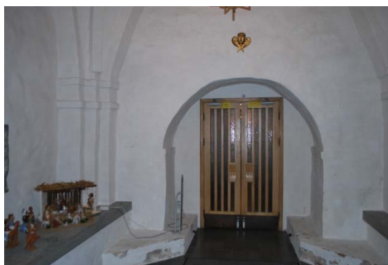
Vapenhuset i tornet.