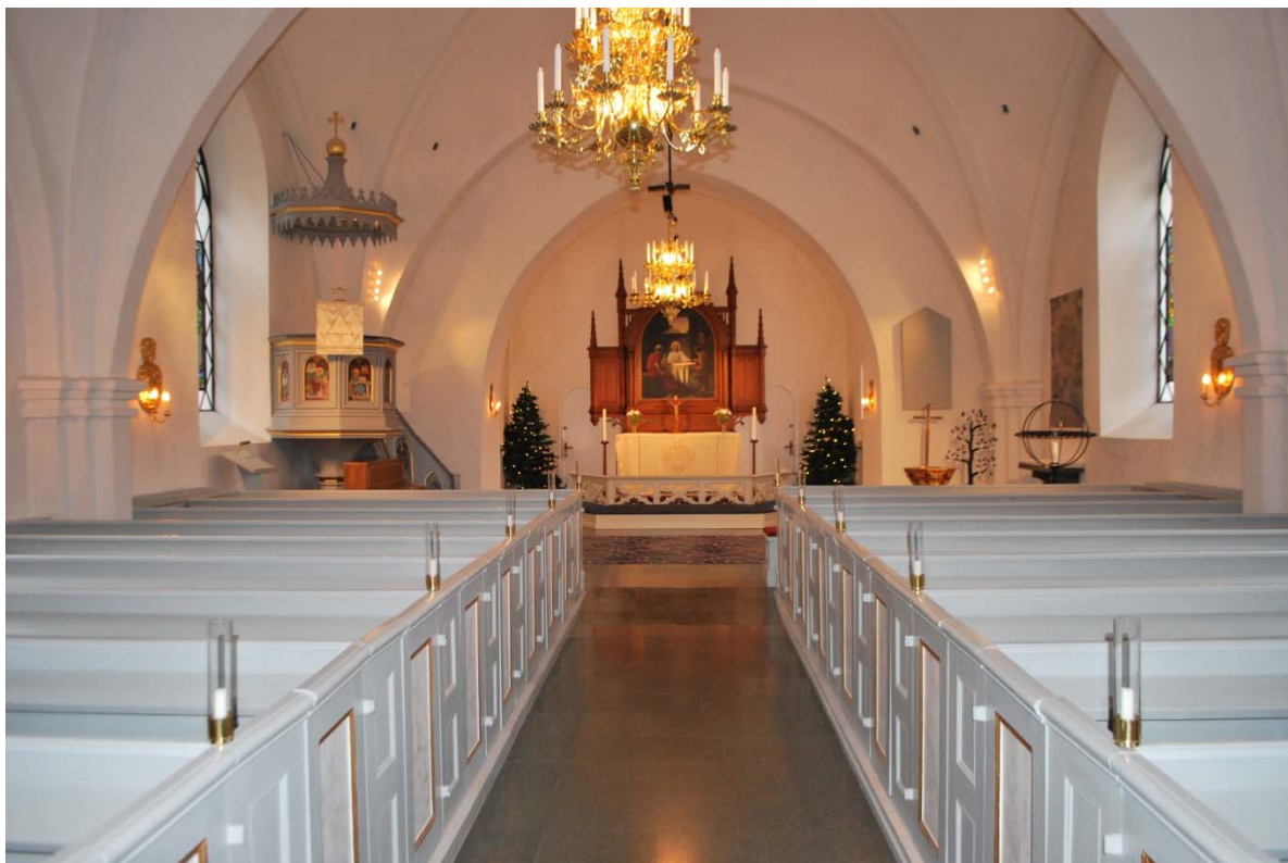
Långhuset mot koret

Långhuset har sex fönster utan innerbågar. De två östligaste fönstren är försedda med glasmålningar av Pär Siegård och Nils Möller. I taket hänger mässingkronor och på väggarna sitter mässinglampetter. Den östra delen av långhuset är upphöjt och höjdskillnaden tas upp av en kort ramp av kalksten. Dopfunten står på sydöstra och predikstolen på nordöstra sidan av långhuset. Här finns även dopträd, ljusbärare och piano. På sydväggen hänger ett dopaltare av kalksten.