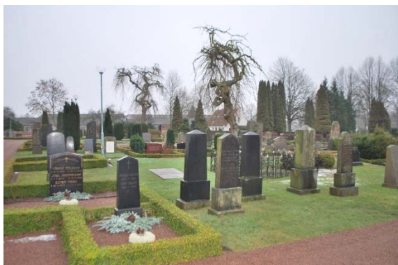
Kvarter 1 söder om kyrkan.

Personalhus och förråd ligger sydöst om kyrkan. Fasaden är vitputsad och sadeltaket är täckt med röda tegelpannor. Byggnaden från 1970 är ritad av Lindström & Ernehagen.