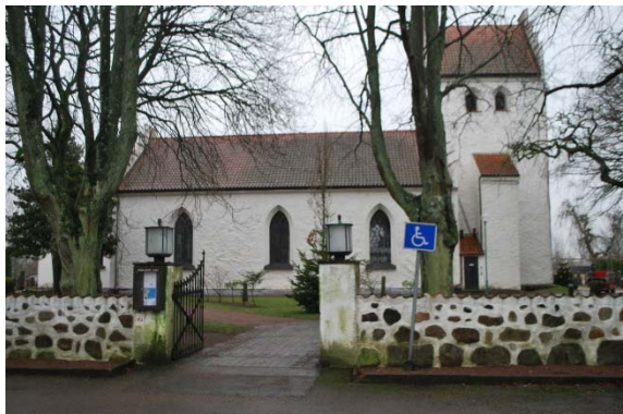
Fasad mot norr.

Torn, långhus och kor har trappstegsgavlar avtäckta med tegelpannor. Vissa av gavlarna är försedda med blinderingsnischer. Ankarjärn i form av kryss finns på tornets övre del.