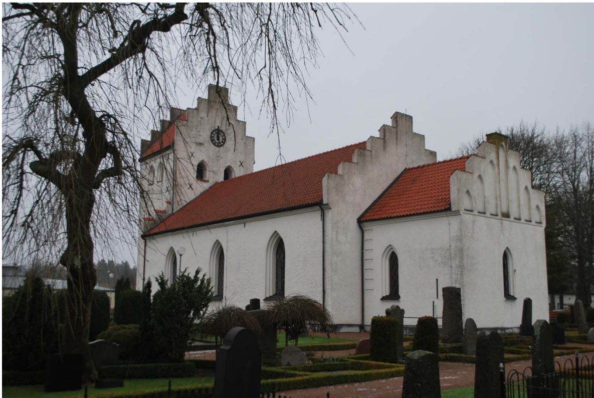
Fasad mot sydöst.