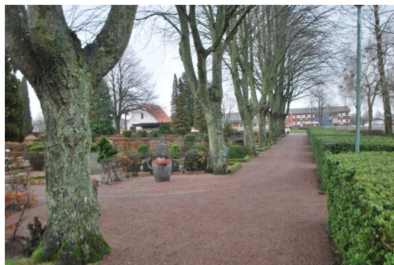
Mellan kvarter 2 och 3.