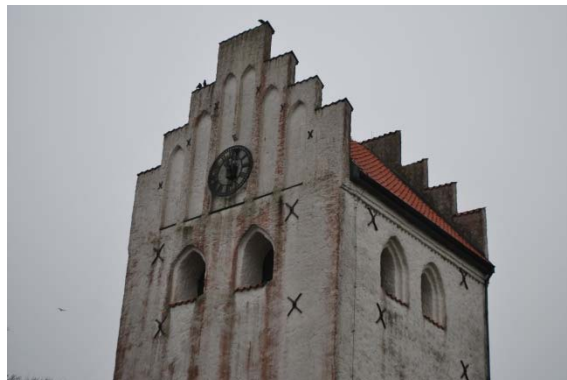
Tornets fasad mot sydväst.

Långhuset har sex stora, spetsbågiga fönsteröppningar som sitter i slätputsade nischer med tre språng. Gjutjärnsbågarna är delade i två spetsbågiga delar med ett diagonalt spröjsverk med ett fyrpass i övre delen. Glaset är klarglas förutom i fyrpasset. Koret har tre smalare spetsbågiga fönster. Solbänkarna är täckta med svartmålad plåt. Dessutom finns ett smalt högt fönster i sakristian med glasmålning av Nils Möller. Kyrkans huvudentré är i tornet i väster. Dörren är en bred ekdörr från 2003 klädd med vertikala ribbor. Dörren har överljus och sitter i en spetsbågig öppning med tre språng. Dörren till sakristian är klädd med koppar och sitter i en rundbågig öppning. Ingången till tornets trapphus är en bräddörr. Toalettdörren är klädd med koppar. Taket är sadeltak över torn, långhus och kor. Trapphus och toalett täcks av pulpettak. Samtliga tak är belagda med röda enkupiga tegelpannor. Takavvattningen är av koppar.