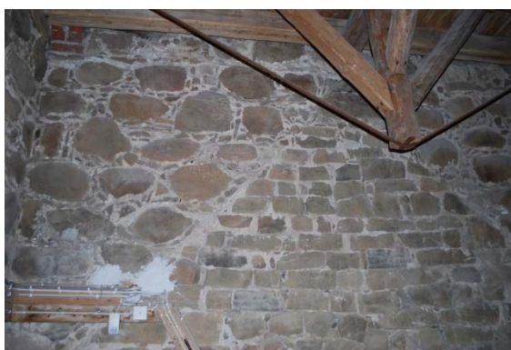
Plan två i tornet. Rester av äldre gavelröste.