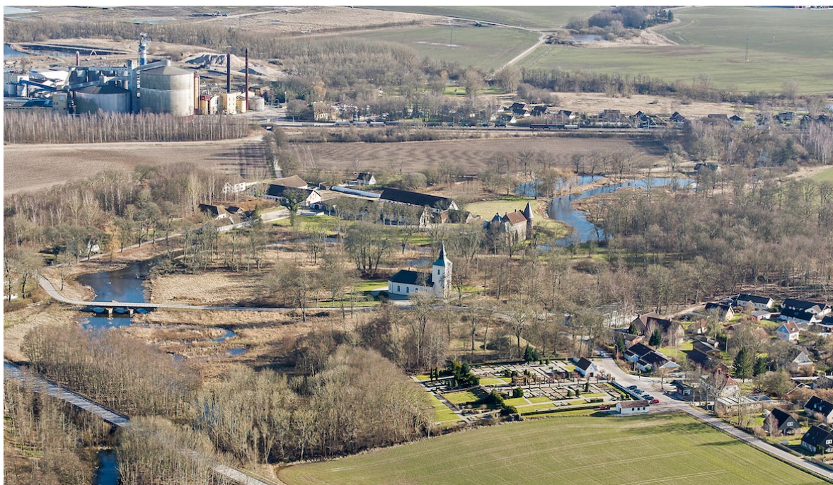
Flygbild över Örtofta tagen från norr, 2014. I bildens övre vänstra kant syns Örtofta sockerbruk, i dess mitt kyrkan och kyrkogården, och strax bakom Örtofta slott med ekonomibygnader.

Örtofta säteri har medeltida anor, och den äldste kände godsägaren är Trugot Has som skrev sig till "Yrtofta" 1380. Först under slutet av 1400-talet uppfördes en försvarsborg, strategiskt placerad intill ån. Delar av borgen ingår ännu i slottets murar. Vid medeltidens slut och under 1500- och 1600-talen var Örtofta landskapets enda adliga birk, vilket innebar att godsherrn hade full domrätt över befolkningen i området.