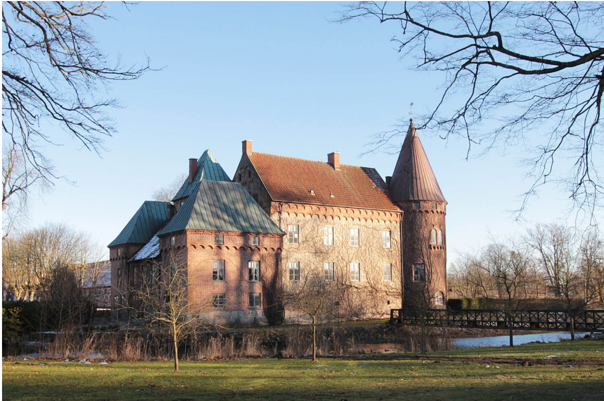
Örtofta slott restaurerades i mitten av 1800-talet av den danske arkitekten Ferdinand Meldahl i fransk renässansstil.

Ingen vet emellertid längre var den medeltida tingsplatsen låg. Utöver sitt juridiska inflytande var godset också en stor fastighetsägare. Under 1500-talet tillhörde 23 av socknens 25 gårdar säteriet, och vid 1600-talets slut förfogade godsherren över socknens samtliga gårdar.