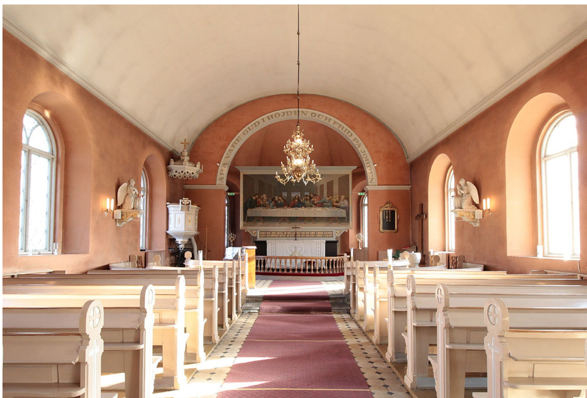
Kyrkorummet sett åt öster.

finns en modern spiraltrappa som förbinder vapenhuset med klockvåning och vindar. En småpröjsad pardörr med lunettformat överljus leder in till kyrkorummet.