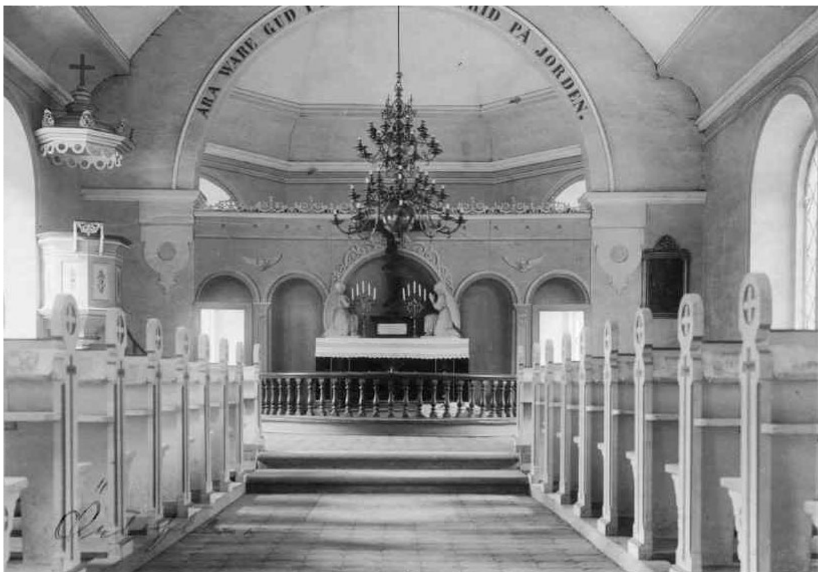
Koret innan 1927.

Årtalet 1639 som än idag står skrivet på den västra tornfasaden markerar tidpunkten för en ombyggnad, vilken troligen rörde höjning av tornet.