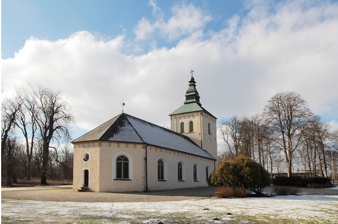
Kyrkan sedd från nordost.