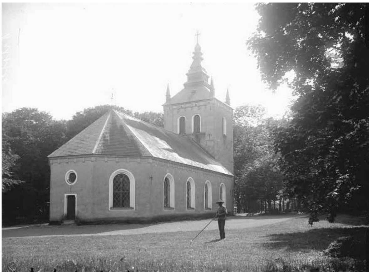
Örtofta kyrka fotograferad från öster någon gång mellan 1904 och 1906. Notera att tornets hörnspiror ännu fanns kvar.

En romansk kyrkobyggnad i sandsten uppfördes i Örtofta redan under 1100- eller 1200-talet. Kyrkan låg där den nuvarande kyrkan ligger men var betydligt mindre med långhus med smalare rakslutat kor åt öster. Korets östra vägg slutade strax innan den nuvarande kortrappans början. Under senare medeltid tillkom tornet och ett vapenhus intill långhusets södra sida. Av den medeltida kyrkan återstår idag enbart grundmurarna och delar av tornet. Vid en arkeologisk undersökning 1953 påträffades en sandstenskvader med ett stenhuggarmärke som tillhörde "Mästaren med korstriangeln". Stenen är idag placerad utomhus vid långhusets nordvästra hörn.