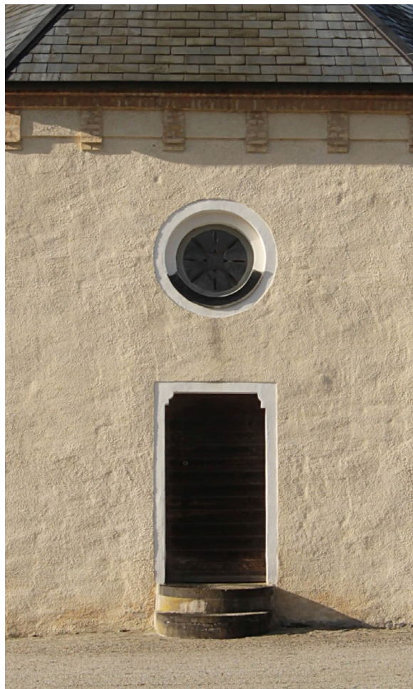
Prästingången i öster leder in till sakristian.

Tornets nedre del domineras av den basilikalt utformade västportalen i oputsat gult tegel. Över ingången sitter ett runt fönster och strax över portalen en minnessten över den stora ombyggnaden 1862. Klockvåningen har två ljudöppningar åt öster och väster och en åt norr och söder. Luckorna består av liggande grönmålade brädor. Västfasadens ankarlutar bildar årtalet 1639, tidpunkten för en tidigare ombyggnaden av tornet.