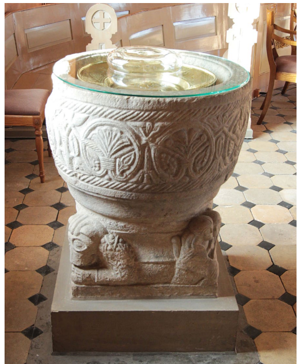
Dopfunten från 1100-talet höggs av Mårten stenmästare.

Bänkinredningen består av öppna bänkar, 15 i långhuset och tre svängda bänkar i koret. Bänkgavlarna är dekorerade med latinska kors och pilformiga grekiska kors placerade i cirklar upptill, båda utförda i försänkt relief. Bänkinredningen ritades av Abraham Pettersson och är bevarade sedan kyrkans nyuppförande 1862.