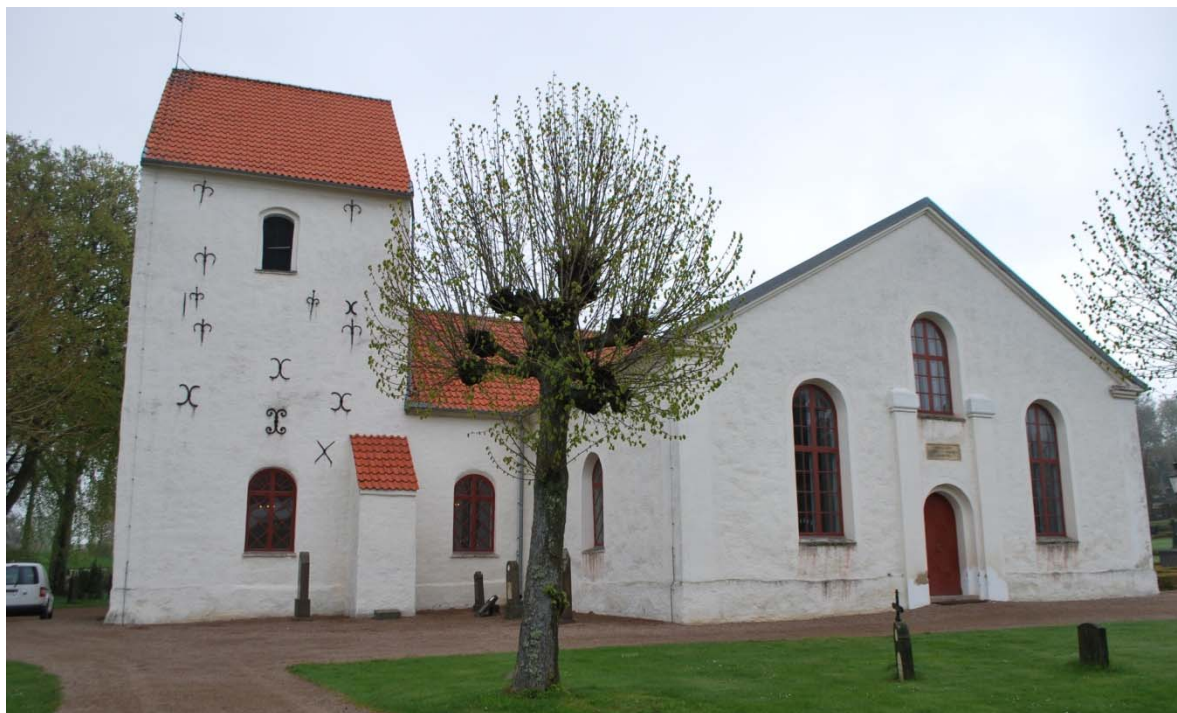
[1]: Kyrkan från sydväst

perioder. De översta delarna är av maskinslaget tegel. Både tornets- och långhusets sockel är av gråsten, uppåt avslutad med ett skift av skråkantsprofilerad sandsten. Tornets trapptorn och norra strävpelare är murad i handslaget rött tegel, medan den södra är av gråsten. Korsarmarnas murar är utförda som skalmurar med i yttre muren gråsten i oregelbundna skift. Gavelröstena är murade av återvunna sandstenskvadrar.