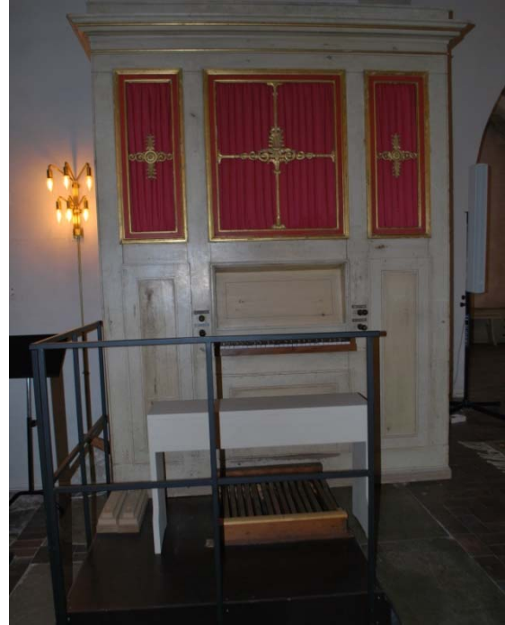
[5]: Kororgeln av Ramus