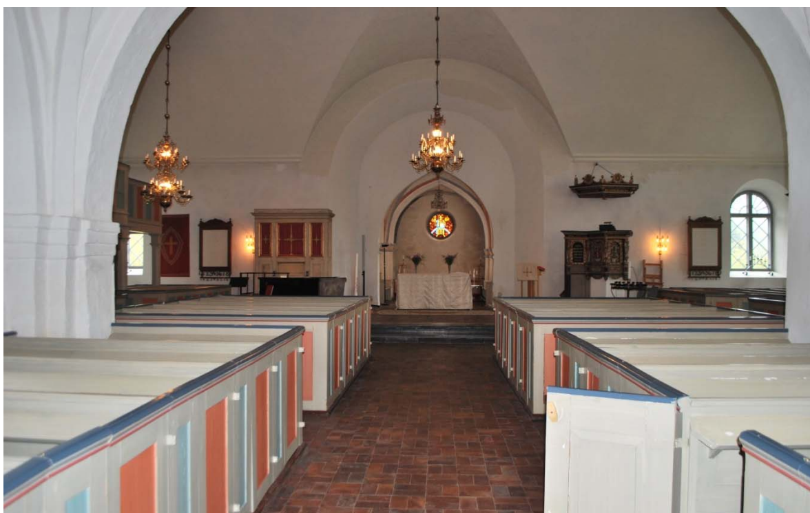
[2]: Långhuset mot koret

Från västporten kommer man in i tornets bottenvåning, som fungerar som vapenhus. Golvet är belagt med brun skrombergaklinker, väggarna är slätputsade och vitfärgade. Rummet täcks av ett fyrkappigt, halvstens, spetsbågigt kryssvalv med firsidiga ribbor, som vilar på tresprångiga pilastrar. Kragbanden utgörs av tre platt. Tornbågen mot långhuset är spetsbågig med släta imposter vid båganfangen. Genom valvet löper en bjälke och ett dragstål. I den sekundärt murade tegelväggen mot långhuset sitter en raktäckt, grågrönmålad ramverksdörr. Långhuset [2] nås genom en trappa i kalksten.