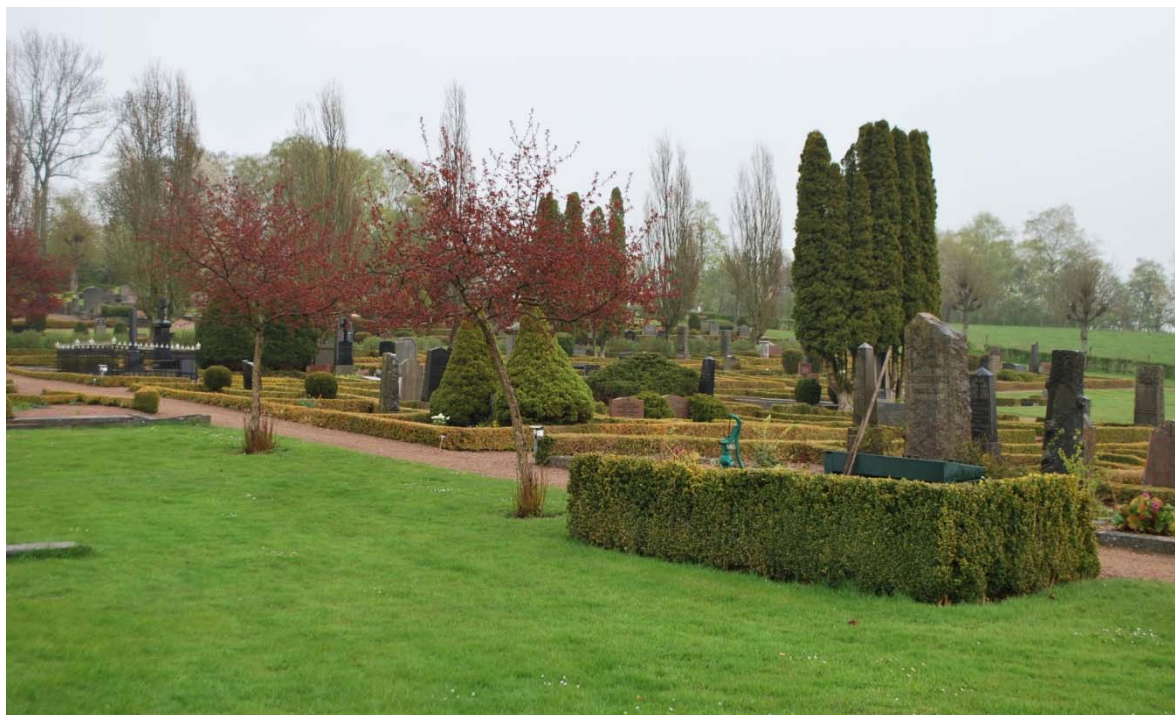
[6]: Kyrkogården mot öster, vy mot utvidgningen från 1884

hantverkare, vilket illustrerar Ottarps utveckling vid förra sekelskiftet. I sydöstra hörnet finns en cirkulär askgravplats med två kransar med vårdar. I mitten finns en viloplats med en stenbänk och ett cortenkantat växtkärl böjda mot varandra.