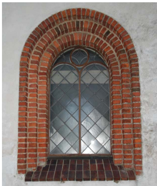
[2]: Fönster på långhuset

Tornets- och långhusets fönsteröppningar är rundbågiga, inramade av oputsat, rött tegel i tre språng [2]. Fönstren har solbänkar av rödbrunt stengodstegel lagt på flatan. De brunmålade ytterbågarna, som är fastbultade till väggarna, är indelade i ett nedre parti med två rundbågar i trä, och överst en friare del med en cirkel inskriven i mitten. Fönsterlufternas glas, till viss del av äldre sort, är insatta i ett diagonalt spröjsverk av bly. Det nordvästra fönstret har ett yttre plattjärn som fungerar som glaslist. Denna konstruktion har i övriga fönster ersatts av ett invändigt plattjärn med kittfals, som svetsats till stormjärnet. Fönstren är försedda med gråmålade innerfönster, vars utseende imiterar de yttre bågarnas. Absidens två rundbågiga fönster är omfattade av tegel i ett språng, och har solbänk av rött murtegel. Bågarna är av trä med glasrutorna i ett diagonalställt spröjsverk.