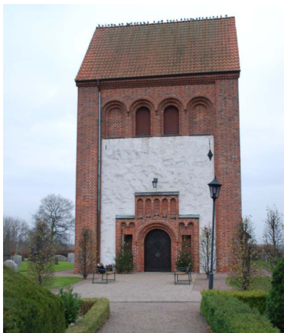
[1]: Tornet mot väster

är, att kormurarna murats om vid något tillfälle. Hörnkedjor och omfattningar är av kvaderhuggen sandsten, som idag har överputsats. Skillnaden i bearbetning mellan grå- och sandstenen kan anas i fasaderna, då dess sandstenshörn är slätare än övriga murpartier. Absiden och tornets nedre del är uppförda av kluven gråsten. I tornets hörn finns tegelpilastrar, som bär upp tornets övre del med massivmurar i tegel murade i vendiskt förband [1]. Den östra tornmuren är dock av putsad gråsten ända upp till takgesimsen. I teglet märks ett antal lagningar, vars stenar har en rödare, mer homogen färg än de ursprungliga. I fasaderna sitter flera ankarjärn av olika typ.