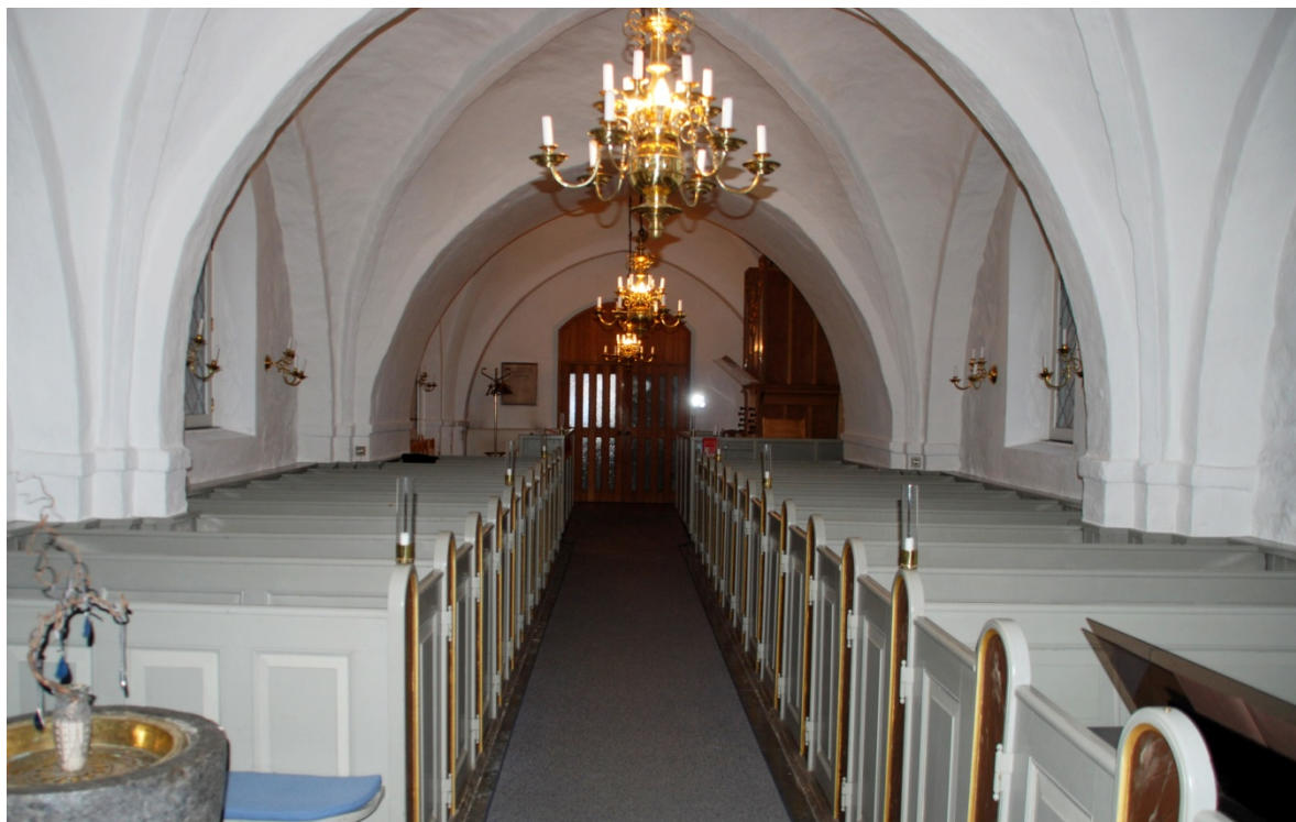
[3] Långhuset mot väst

slätputsade och målade med modern, vit färg. Kalkmålningarna är förputsade.