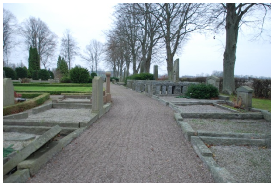
[8]: Utvidgningen från 1897 med stenkantade gravar