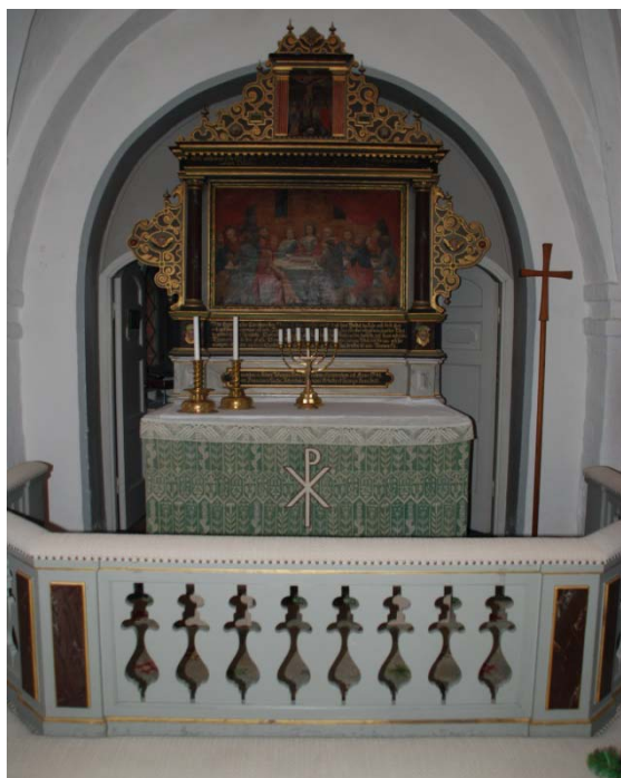
[4]: Altarring, altare och altaruppsats

Predikstolen [5] är byggd 1880 av byggmästare N. Andersson. Den sexsidiga korgen står på ett sexkantigt profilerat skaft. Överliggaren, dekorerad med urskurna rosor, bärs av brunmarmorerade pelare, som kopplats med kolonetter på ömse sidor. På dessa ligger entablement, som bär äggstavsdekorerade rundbågar. I bågarne finns målningar som föreställer Petrus och evangelisterna. Räckesbarriären är tät med rundbågiga speglar. Ovan predikstolen hänger en sexkantig baldakin krönt med ett klöverbladskors. Ljudtakets insida är dekorerad med ett strålformat listverk och en hängande duva.