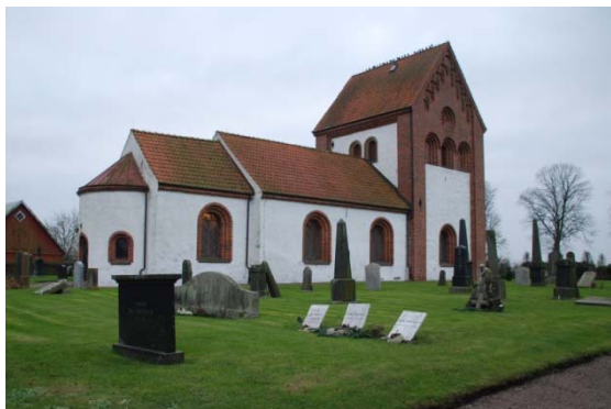
[6]: Gamla kyrkogården

muren utgör en fortsättning på 1897 års kvarter med grusade och stenkantade gravplatser. De äldsta gravarna, som finns längs den västra sidan, är ofta låga diabasvårdar, medan stenarna i norr är yngre i funktionalistisk stil. Gravplatsernas växtlighet varierar kraftigt med inslag av både mer moderna växter och frodig vintergrönska.