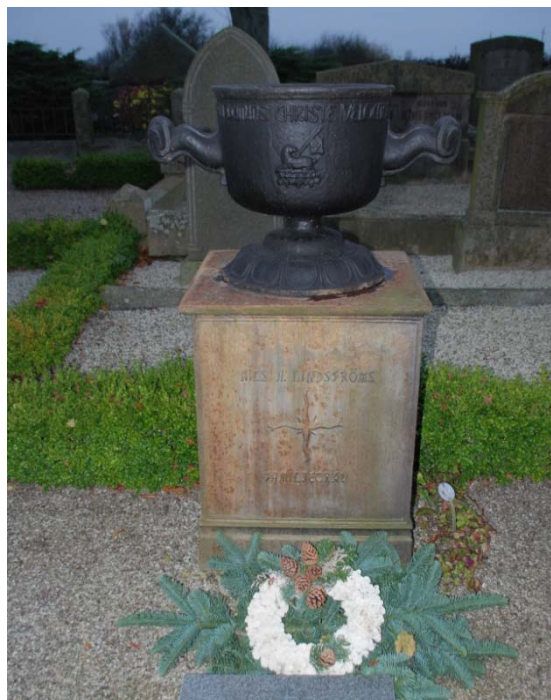
[9]: Nils A Lindströms grav av gjutjärn

Minnes- och urnlundarna är anlagda längs den nya kyrkogårdens östra kant. Minneslundens är täckt av gräs med en central, stenkantad plantering med olika marktäckare. I gräset står en natursten med texten ”Ingen är glömd av Gud”. Urnlunden består av två rader av stenkantade gravplatser, lagda på ömse sidor om en stensatt mittgång.