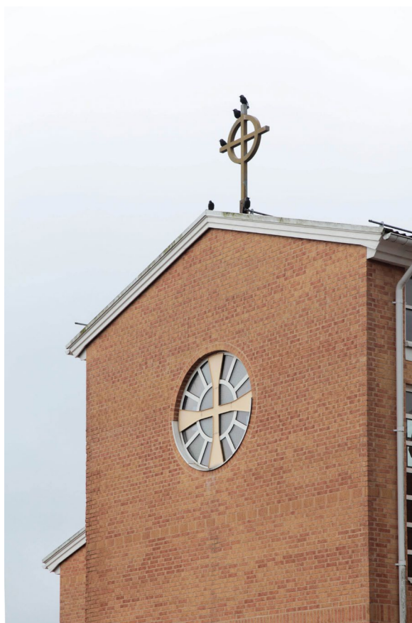
Den östra korbägen pryds upp till av ett hjulkors.

Den östra gaveln pryds av ett gulmålat ringkors. I mitten på fasaden finns ett stort rosettfönster med ett kors i plåt ytterst. Formen är inspirerad av en barnteckning från den gamla församlingsgården föreställande en soluppgång. Omgjord till en hel cirkel bildar den fönstrets form.