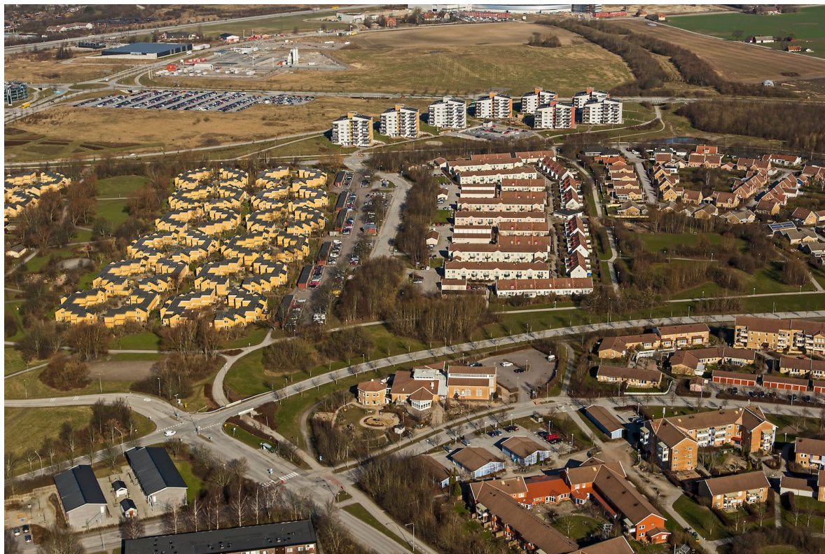
Flygbild över Östra Torn tagen från söder, 2014. Maria Magdalena kyrka syns något nedanför bildens mitt.

Östra Torn var ursprungligen en liten by som förr enbart hette Torn. Namnet hör sannolikt samman med häradsnamnet Torna. I äldre tider låg här en kult- och en tingsplats. Första gången byn nämns är omkring 1120 då det berättas att kung Sven Estridsen (1047–74) skänkt mark ”In villa Thorni” åt biskopskyrkan. Det ägandeförhållandet kom att i hög grad påverka bebyggelseutvecklingen i området då gårdarna och marken arrenderades ut istället för att säljas till enskilda ägare. Troligen låg byn under biskopsstolen under större delen av medeltiden, men drogs in till kronan efter