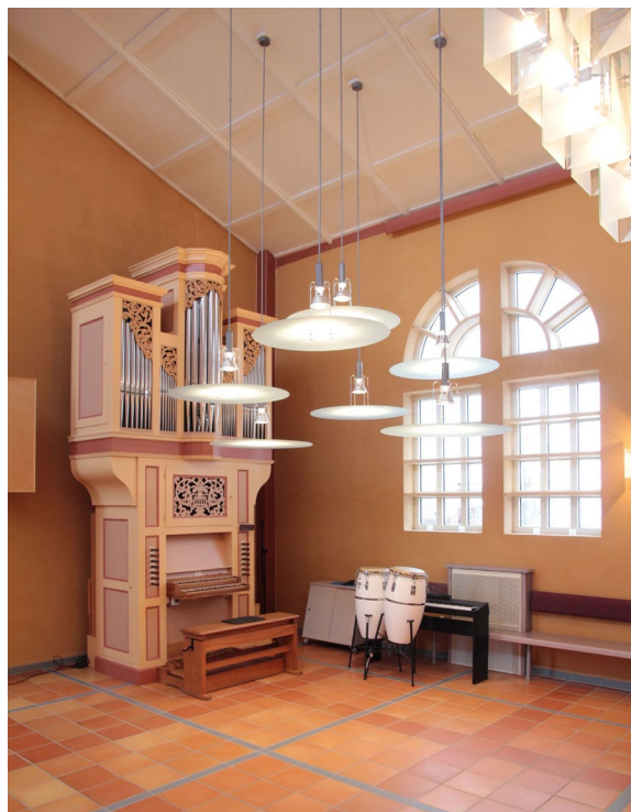
Utrymmet vid orgeln lysas upp av sju plafondlampor.

Kyrkorummet saknar fasta bänkar och har istället stolar placerade i vinkel in mot mitten. Stolarna är placerade så att ett stort och fritt utrymme skapas längst fram i koret. Ytterväggarnas murar åt norr, öster och söder bär en tunn slätputs där det underliggande teglets form bitvis kan skönjas. Väggarna är målade i en dämpad, ockragul kulör. Längs kyrksalens väggar finns väggfasta bänkar av grålaserad, stavlimmad bok. På väggen ovanför bänkarna finns vadderade ryggstöd som klätts med samma mönstrade blålila tyg som stolarna. Den västra väggen är klädd med skivpanel i lackat trä. Merparten av panelen är spårad i kvadratiska mönster för att förbättra akustiken.