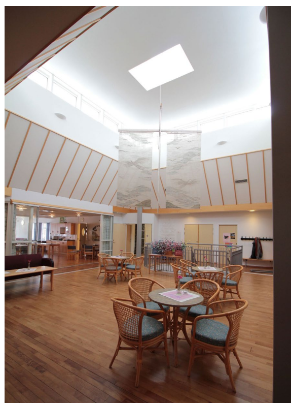
Kyrktorget som förbinder kyrkrummet med kaféet och förskolan.

Kyrksalen utgörs av ett enda rum. Normalt sett träder man in i salen genom den mittersta dörren. Framför sig har man då via sacra som leder rakt mot koret och altaret. Fyra rödmålade pelare – av församlingen kallade ”de fyra evangelisterna” – bär upp de kraftiga limträbalkar