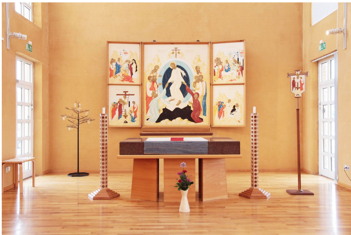
Koret med ljusbärare, altare och altaruppsats.

Vävnaden i foajén tillverkades av textilkonstnären Gerda Wissler. Vävnaden är upphängd i ett fyrdelat kors och placerad i mitten av kyrktorget. Motivet är rastande tranor vilka brukade ses omgivningarna kring Östra Torn. Vävnaden är tillverkad i linvarp med inslag av handspunnen ull.