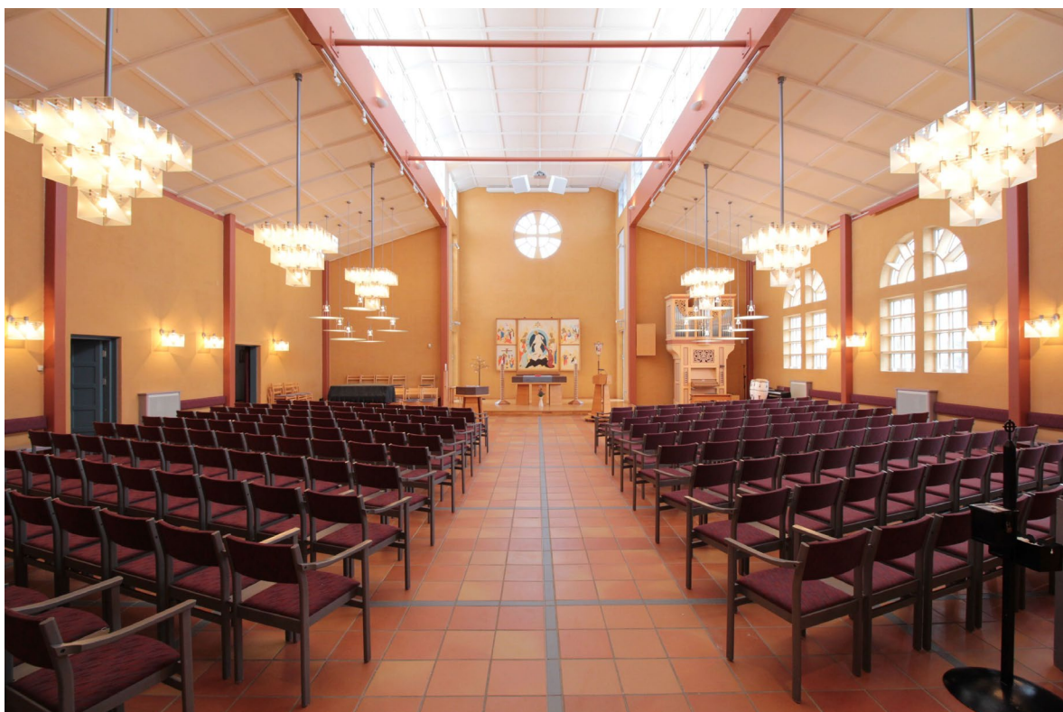
Kyrkorummet sett mot koret i öster.