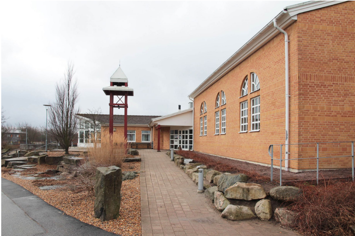
Kyrkans huvudingång återfinns på den södra sidan och delas med förskolan.

Det första spadtaget för kyrkans grund togs eftermiddagen den 28 augusti 1991 under inblandning av ett stort antal församlingsmedlemmar. Sent på nyårsnatten 1991 gick ett fackeltåg från den gamla församlinggården till byggarbetsplatsen. Deltagarna samlades på den nygjutna betongplattan i den del som skulle komma att bli koret, för att vid tolvslaget inviga den nya församlingen – Östra torns församling.