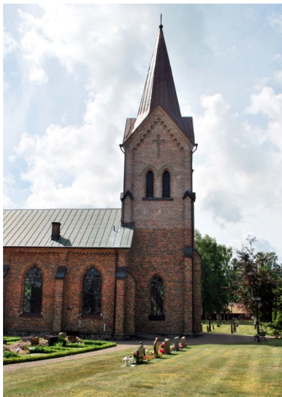
[1]: Tornet från norr

Kyrkan har tre entréer; huvudingången via vapenhuset i tornet, en prästingång till absiden och en dörr till den ena handikapptoaletten. Västportalen är tresprångig, spetsbågig och omgiven av ett ”ögonbryn” med lesbisk kymation. Ovanför frisen sitter en minnestavla över kyrkans tillkomstår. I portalen sitter en raktäckt pardörr från 1988, utvändigt klädd med lackad, snedställd ekpanel. Trycket är av äldre modell. Ovan dörren finns ett spetsbågigt överljus med dekorativ gjutjärnsspröjsning i form av stjärnor, tre- och fyrpass med delvis blåtonat glas. Absiddörren av okänd ålder är raktäckt och klädd med stående, brunmålad smal träpanel. Dörren till toaletten [2] är sannolikt ursprunglig, uppbyggd av ramverk med i mitten snedställd pärlspontad rödbrun panel och med typisk gotisk beslagning i form av svarta smidda nyckelskyltar, drakformade gångjärn och hörnjärn. En betongramp från 2001 leder upp mot dörren.