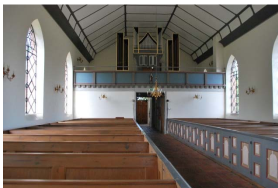
[5]: Långhuset mot orgeln