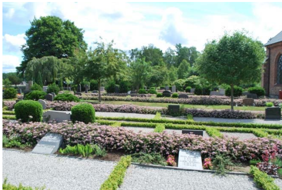
[8]: Kyrkogårdens norra sida