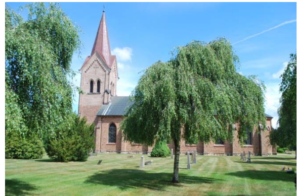
[9]: Kyrkogårdens södra sida