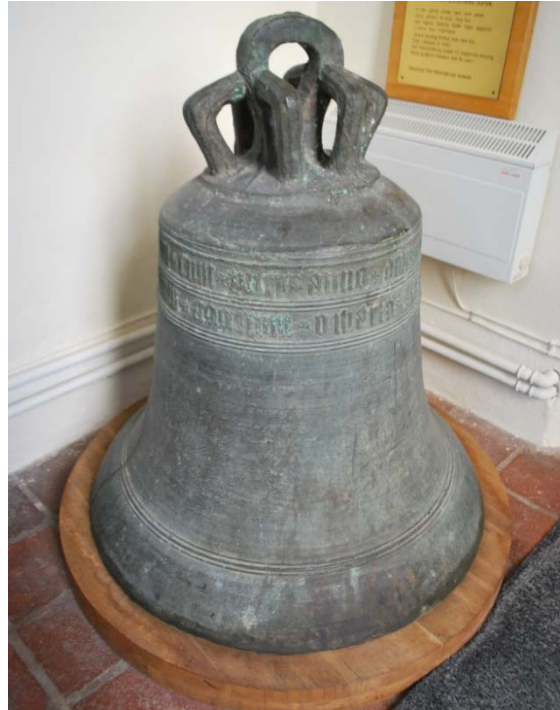
[7]: Gotisk kyrkklocka, 1480