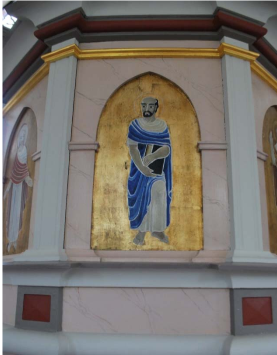
[6]: Detalj av predikstol, målning av Pär Siegård

minuskeltext, förvaras numer i vapenhuset. Lillklockan, den yngsta klockan, är gjuten av M& O Ohlssons klockgjuteri i Ystad, storklockan hos Jens Jensen i Halmstad. Den sistnämnda är dekorerad med bårder, texter, medaljonger och reliefer.