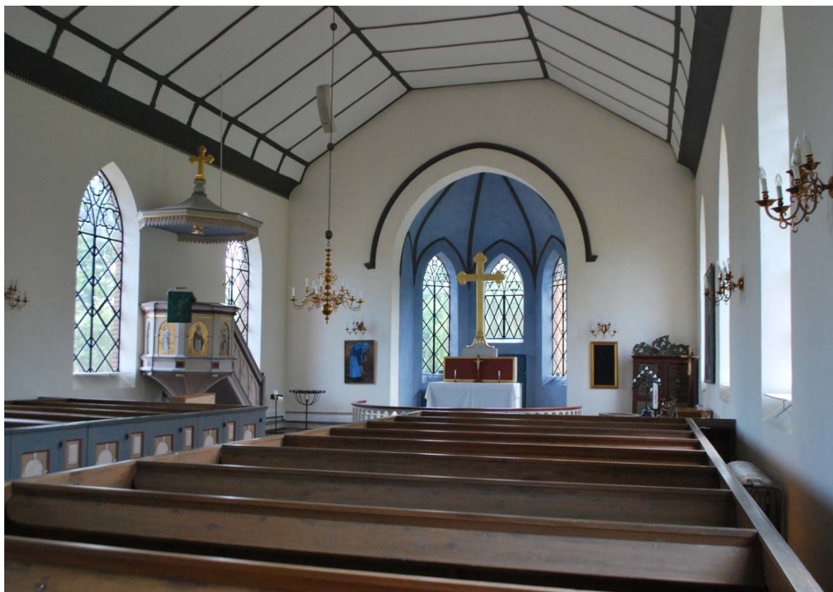
[4]: Långhuset mot koret

skärmar för att ge plats åt ett installationsutrymme med bl.a. äldre sektionradiatorer. Rummet täcks av ett tredingtak som fältindelats med vävspända och vitmålade putsfält. Listverket och den kraftiga taklisten med hålkäl och tandsnitt är målade med grå oljefärg. Längst mot öster finns en stor yta framför altarringen, där bl.a. dopfunt, dopaltare, ljusbärare, piano, ett skåp och predikstol är placerade.