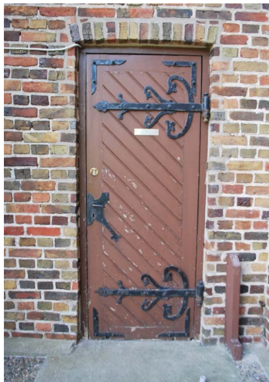
[2]: Ytterdörr till toaletten

Långhuset, absiden och tornet belyses av spetsbågiga fönster [3] med tvåsprångiga om-