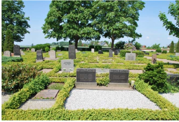
[7]: Utvidgningen från 1892