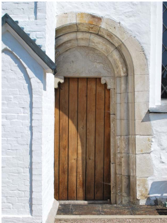
[2]: Den romanska sydportalen

Absidportalen från samma tid är långsmal med en brädklädd och lackad enkeldörr och ett överljusfönster. Utöver dessa ingångar finns de romanska norr- och sydportalerna, som är frilagda mot det yttre men igensatta med stående bräder framför det inre murskalet. Norrportalens rundbågiga tympanonfält pryds av livsträdet, som flankeras av en sfinx och ett lejon. Motsvarande relief på sydportalen [2] föreställer två lejon, som är fastbundna vid livsträdet. Sydportalen är delvis täckt av en strävpelare. Reliefernas symbolik är svårtydd; det har föreslagits, att nordsidans bilder skulle kunna föreställa syndafallet medan södra sidan skulle visa de onda makternas underkastelse under det ”nya” livsträdet Kristus. Lejonframställningarna, som var vanligt förekommande i skånska, romanska stenarbeten, kan dels uppfattas som en länk till det lombardiska områdets arkitektur, dels vara influerade av liknande arbeten vid Lunds domkyrka.