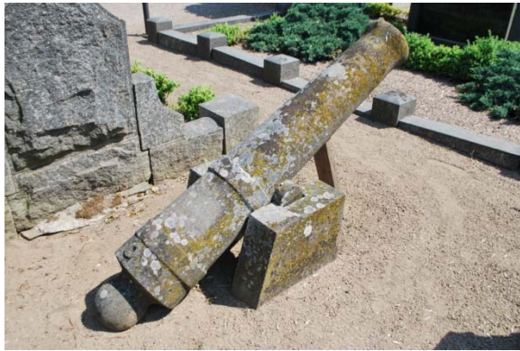
[9]: Nils Sundbergs grav