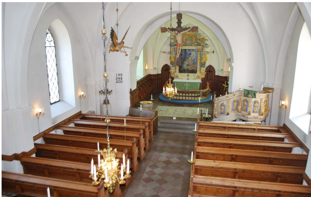
[4]: Kyrkorummet från orgelläktaren mot koret