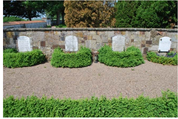
[8]: Bocks familjegrav