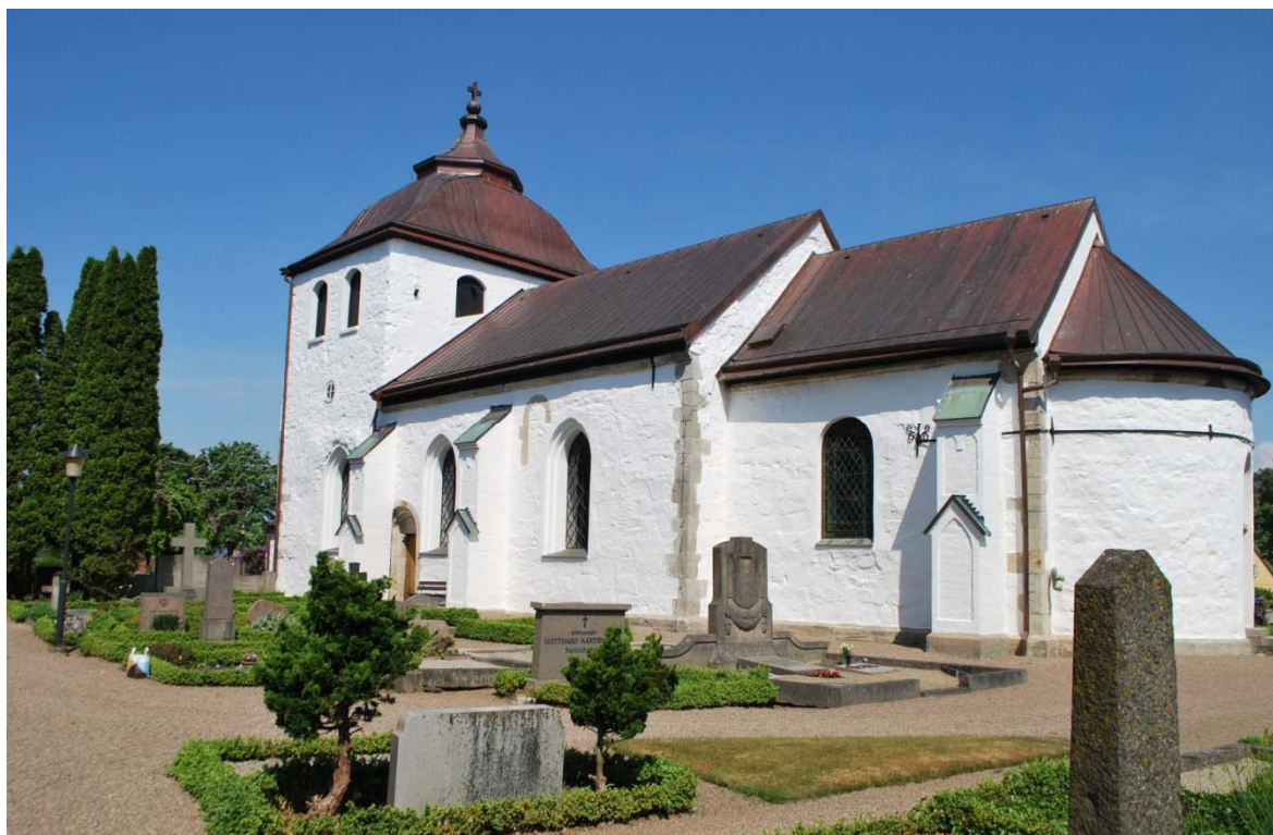
[1]: Kyrkan från sydöst

Kyrkobyggnaden [1] består av ett långhus, ett smalare och lägre kor avslutat med en absid, ett torn och ett vapenhus i väster. Långhuset, koret, absiden och tornet är alla medeltida. Tornets övre del tillkom 1777 och vapenhuset 1802. Under långhuset finns ett pannrum, som nås genom en kopparklädd lucka vid kyrkans norra sida, och under korgolvet en gravkammare från minst 1600-talet efter ätten Gyllenstierna.