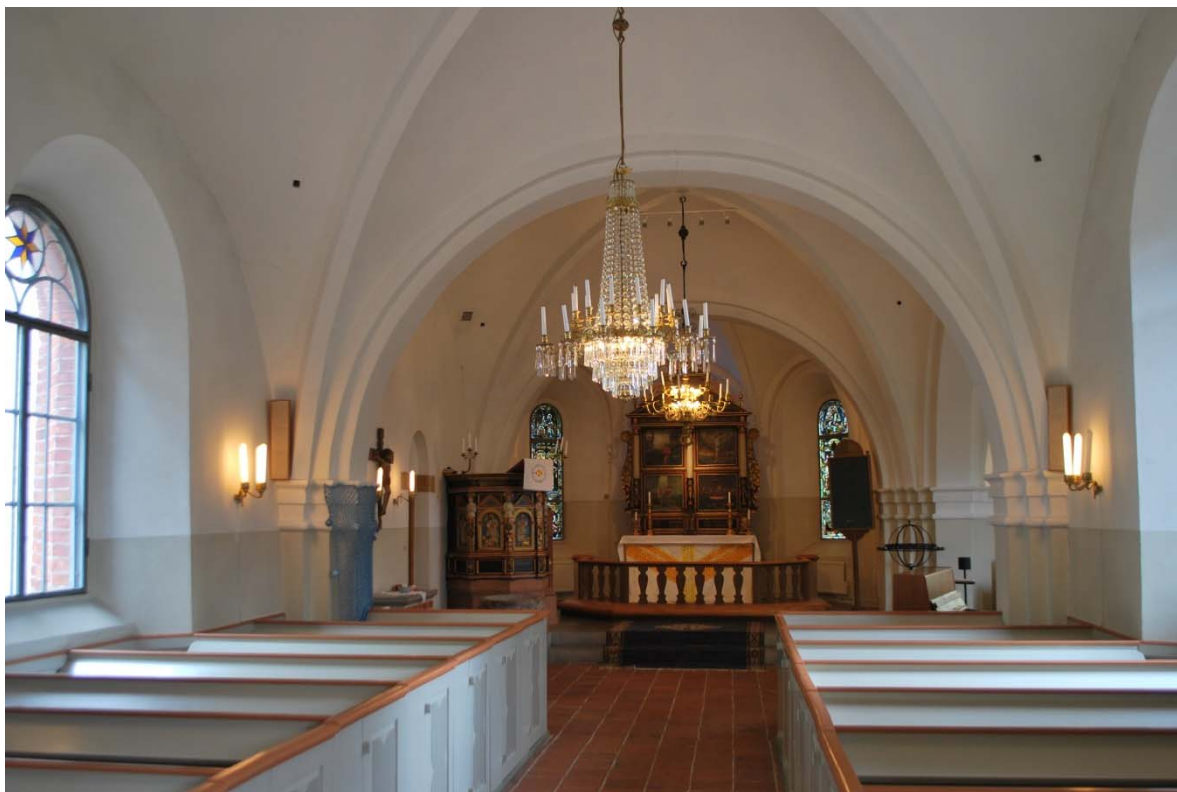
Långhuset mot koret i öster.