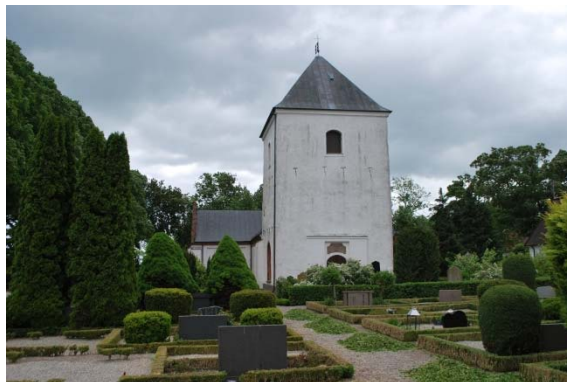
Fasad mot väster.