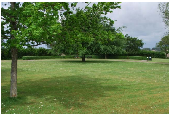
Minneslundan längst i väster.