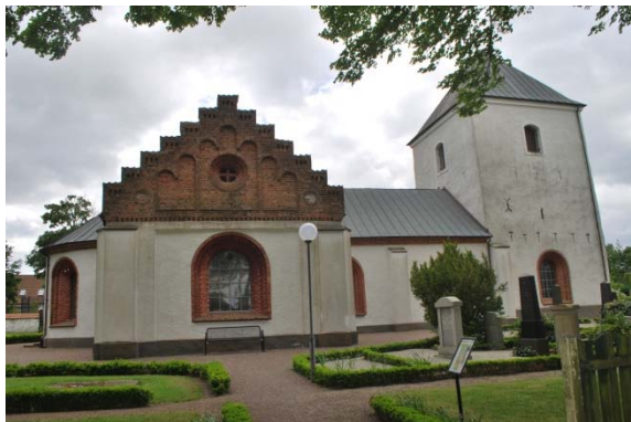
Fasad mot norr.

Tornet är försett med flera svartmålade ankarslut. Korsarmarnas gavelrösten i oputsat tegel är försedda med trappstegsgavlar och rundbågiga blindingar, rundbländen och ett runt fönster.