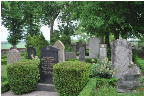
Kyrkogården öster om kyrkan.

Del två västerut är också omgiven av en putsad mur avtäckt med tegel i norr och söder. Trädkransen av oxel är nyplanterad och låg. Här är alla gravar omgivna av buxbom och täckta med singel. Gravarna ligger i strikta rader. Stenarna är låga och horisontella. Mycket vintergröna buskar är planterade på gravarna. Den tredje delen i väster, som är den största, är enbart grässådd med diverse träd och omges av en friväxande häck av hassel med inslag av lövträd, bland annat pil. Här finns minneslundan som har en böjd häck i väster. Från minneslundan finns utsikt över fälten.