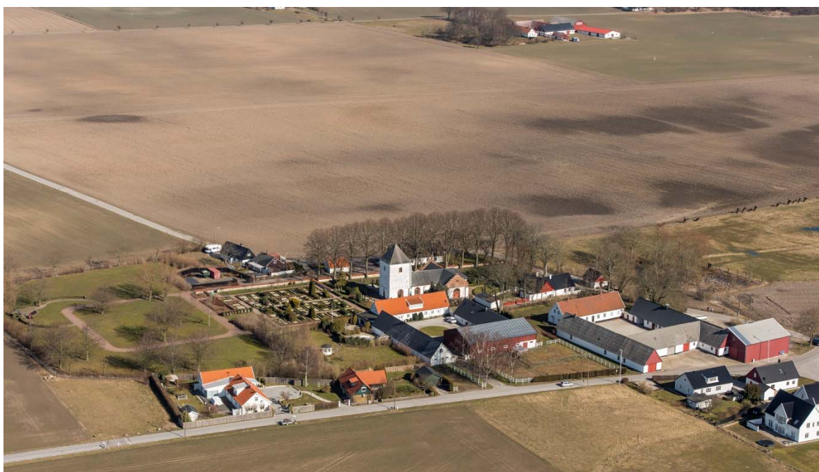
Från sydväst.

Glostorps by ligger sydöst om Malmö, på slätten omgiven av jordbruksmark. Området har varit bebott sen förhistorisk tid vilket fornlämningar visar. Glostorp skrevs Glosthorp på 1300-talet. Ändelsen -torp i betydelsen nybygge brukar hänföras till vikingatiden.