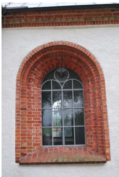
Fönster och tegelfris längs taket.