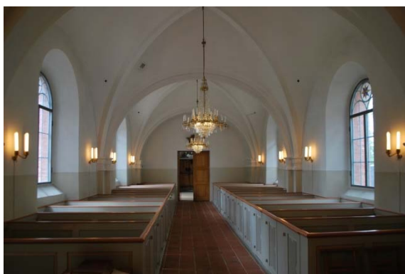
Långhuset mot vapenhuset.