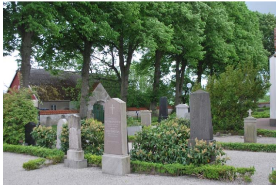
Norr om kyrkan med överbyggd grind i muren.