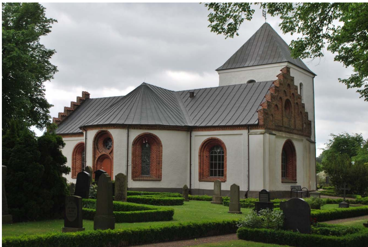
Fasad mot nordöst.