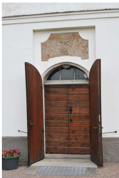
Huvudentré mot väster.

Fönstren av gråmålat gjutjärn från 1861 sitter inmurade i rundbågiga öppningar med rött tegel i flera språng. Även solbänkarna är av rött tegel. Fönstren är indelade i rektangulära partier med halvrunda avslutningar och en cirkel överst. De har klarglas förutom översta cirkeln med färgat glas. Innanfönster med stålbågar sattes in 1954. Långhuset har fyra fönster, tornet två och korsarmarna vardera två fönster. Tegelomfattningarna har tidigare varit rödmålade vilket syns i ovankant där de varit mer skyddade från väder och vind. Korets två smalare fönster har blyinfattade glasmålningar från 1955. Tornet har en ljudöppning i varje väderstreck täckta med brädluckor.