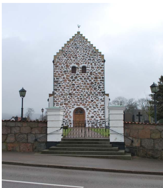
[1]: Tornet från väster

Till kyrkorummet finns två entréer, huvudentrén genom tornets västportal och prästentrén genom sakristian. Tornportalen är rundbågig med en raktäckta pardörr och ett halvcirkelformat överljus från 1961, där två halvcirklar och en helrund båge skrivits in. Rutorna är blyspröjsade likt solfjädrar. Dörren är uppbyggd av ramverk i oljad ek, som indelats i kvadratiska fyllningar. Sakristiaporten, förnyad 1990 men med äldre glas och beslagning, är en pardörr utvändigt klädd med brunrödmålad panel i rombmönster. Ovan dörren sitter ett lunettfönster av liknande typ som tornportens. Förutom dessa dörrar finns en modern dörr till källaren under sakristian, och en brädklädd, brunrödmålad dörr med dekorativa smidesbeslag till tornets övre våningar. Torndörren nås genom en delvis putsad granittrappa med ett enkelt smidesräcke.