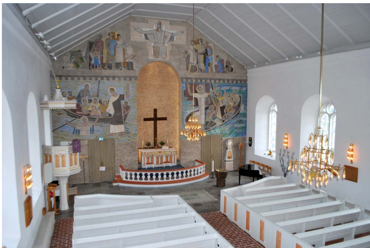
[2]: Kyrkorummet från orgelläktaren