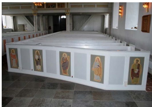
[3]: Bänkar, målningar av Kaj Siesjö

finns en monumentalmålning, påbörjad av Pär Siegård och avslutad efter hans död 1961 av medhjälparen Karl- Einar Andersson. Fresken ”Trons under” [4] är indelad i fem scener; nederst syns t.v. Jesus som sträcker ut handen till Petrus, t.h. Jesus som stillar stormen. Ovanför ett stiliserat tandsnitt finns bilder av jordbrukets- och stadens människor, och som centralmotiv Kristusgestalten ”Kommen till mig”.