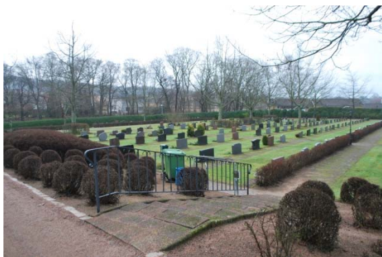
[8]: Utvidgningen från 1972 mot sydöst

minneslund med minnessten och ljusbärare omgivna av grönska. Därifrån leder en grind i muren mot promenadstråket och Möllebäcken öster om kyrkan.