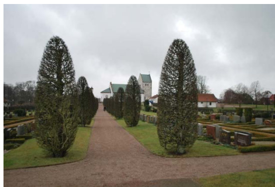
[9]: Utvidgningen från 1913 mot söder