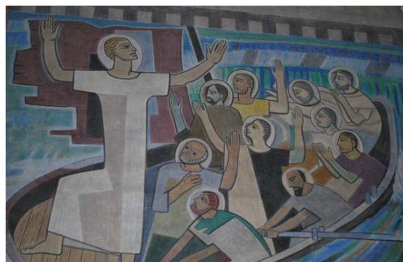
[4]: Utsnitt från Pär Siegårds monumentalmålning

Sakristian har gjutet golv täckt med heltäckningsmatta, slätputsade väggar och inner-tak av gips. Rummet är möblerat med bl.a. fasta skåp för textilier. Från sakristian nås en liten personaltoalett, gömd bakom en gråmålad skärmvägg i ramverkskonstruktion. Genom en lucka i taket når man vinden ovan sakristian. Dess takkonstruktion består av språng- och stickstolar av furu. Underlagstaket är en spontad brädpanel.