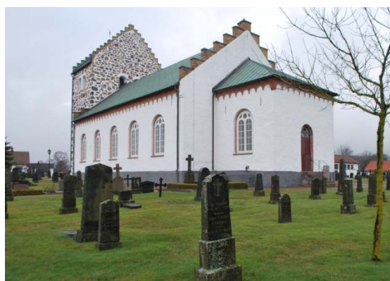
[7]: Äldsta delen av kyrkogården

Marken är täckt av gräs med gravarna ställda i relativt obrutna rader. Gravplatserna saknar avgränsning, förutom ett fåtal med buxboms- eller stenkantsomgärdning. Gravmaterialet domineras av granit- och diabasvårdar från 1850 fram till 1900-talets början. Stenarna är resta med delade socklar och kors eller livstenar med brutna toppar. Det finns också ett stort bestånd av järnkors.