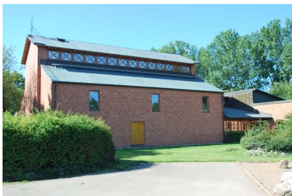
Kyrkan mot norr.

Huvudingången till anläggningen är söder om kyrkan och leder in till entréhall och kyrktorg. Muröppningen till entrén har fyra språng. Dörren är en pardörr av ek med sex glasrutor i varje dörrblad. Nederst finns en sparkplåt av koppar. Entrén markeras av ett skärmtak belagt med koppar och bärs av tre runda trästolpar. Den enda ytterdörren i kyrkorummet består av en nödutgång, denna dörr är klädd med fernissad ekpanel.