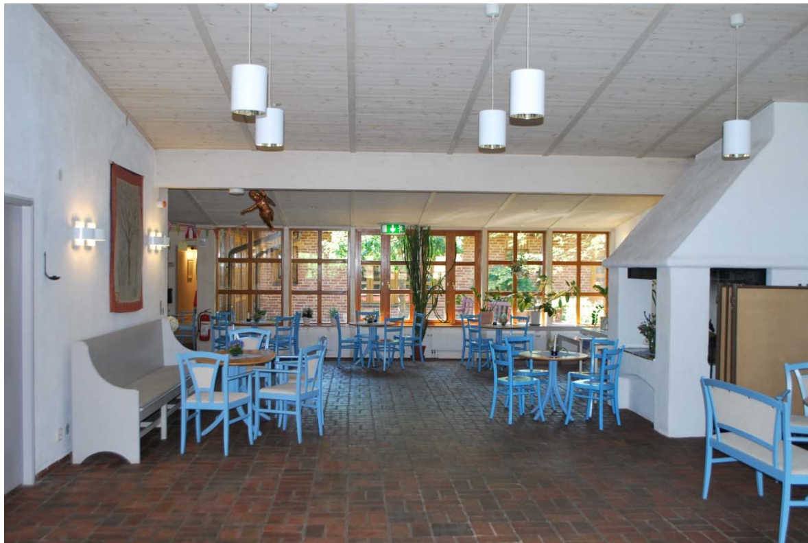
Kyrktorget mellan kyrkan och Mariasalen.

Toaletterna har blått och grönt glaserat klinkergolv.