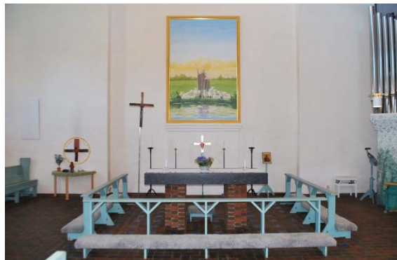
Altare och altartavla.

Predikstolen från 1984 av Holmer är murad av tegel och vitmålad. Predikstolen är en vinklad mur som utgår vinkelrätt från väggen. Sockel och murkrön är av rött tegel. Predikstolen är upphöjd två steg med en murad trappa.