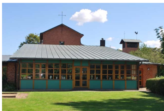
Mariasalen mot väster.

Anläggningen har ett flertal ytterdörrar som vänder sig mot gården och trädgården. Dessa dörrar är av fernissad ek och glas. De olika byggnadsdelarna har invändig förbindelse men har dessutom egna separata ytterentréer.