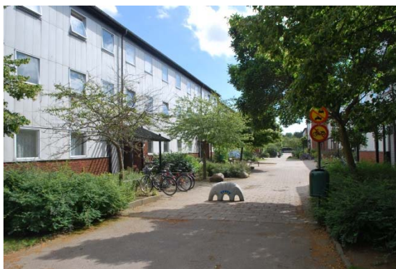
Entrésida till bostäder.

Den gode herdens kyrka finns på Drottninghög i Filborna församling som ligger i nordöstra delen av Helsingborg. Drottninghög har fått sitt namn av en gravhög som anlades under bronsåldern. Området har varit bebott sedan 900-talet. Under medeltiden bestod marken av fäladsmark mellan staden Helsingborg och den nu nästan försvunna byn Filborna som då hade 18 gårdar. Under enskiftet i slutet av 1700-talet flyttades gårdarna ut från byn. Gård nr fem flyttades till närheten av Drottninghögen som fick ge namn till gården som senare flyttades igen till Drottninghögsvägen där boningshuset fortfarande finns kvar. Från 1918 bedrevs en stor fruktodling vid gården. Några mindre småindustrier fanns också, bland annat ett kalkbränneri.