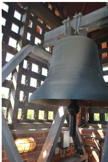
Klocka i klockstapel.