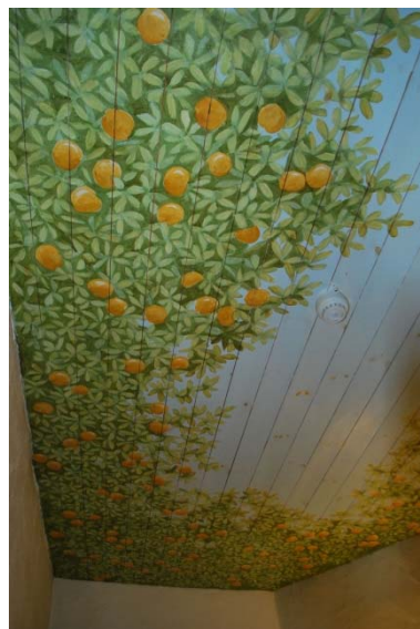
Torn i sakristian.

Orgeln från 1986 är tillverkad av A Mårtenssons orgelfabrik i Lund. Fasaden, ritad av Holmer, är indelad i fyra fält av trä med snedställda överdelar. Synliga pipor av metall finns i tre fält och av trä i ett fält. Den vitmålade fasaden är dekorerad med ett