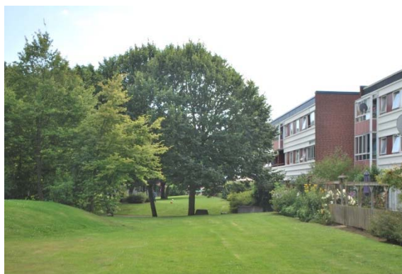
Trädgårdsida till bostäder.

1965 beslutade regeringen att bygga en miljon bostäder under tio år för att motverka bostadsbristen. Drottninghög var en del i detta miljonprogram. De nuvarande husen byggdes 1966-1969 och var det mest storskaliga projekt som genomförts i Helsingborg med 1136 lägenheter. I området planerades också för skola och ett stadsdelscentrum. Bostäderna består av parallellställda trevåningshus av prefabricerad betong, med platta tak och gavlar och socklar klädda med tegel. Huslängorna ligger parvis med en entrégård mellan husen. På trädgårdssidan finns uteplatser och stora grönområden