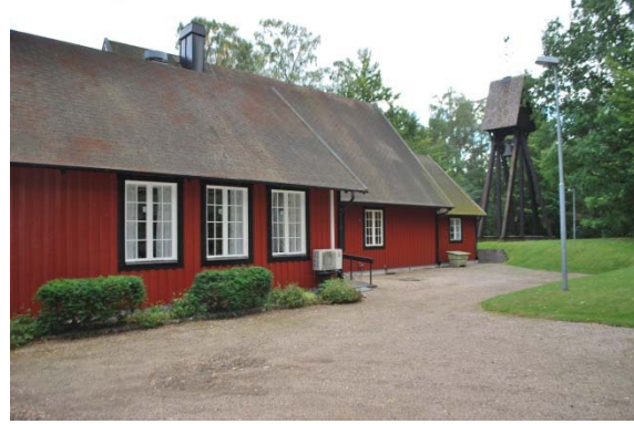
Fasad mot nordväst