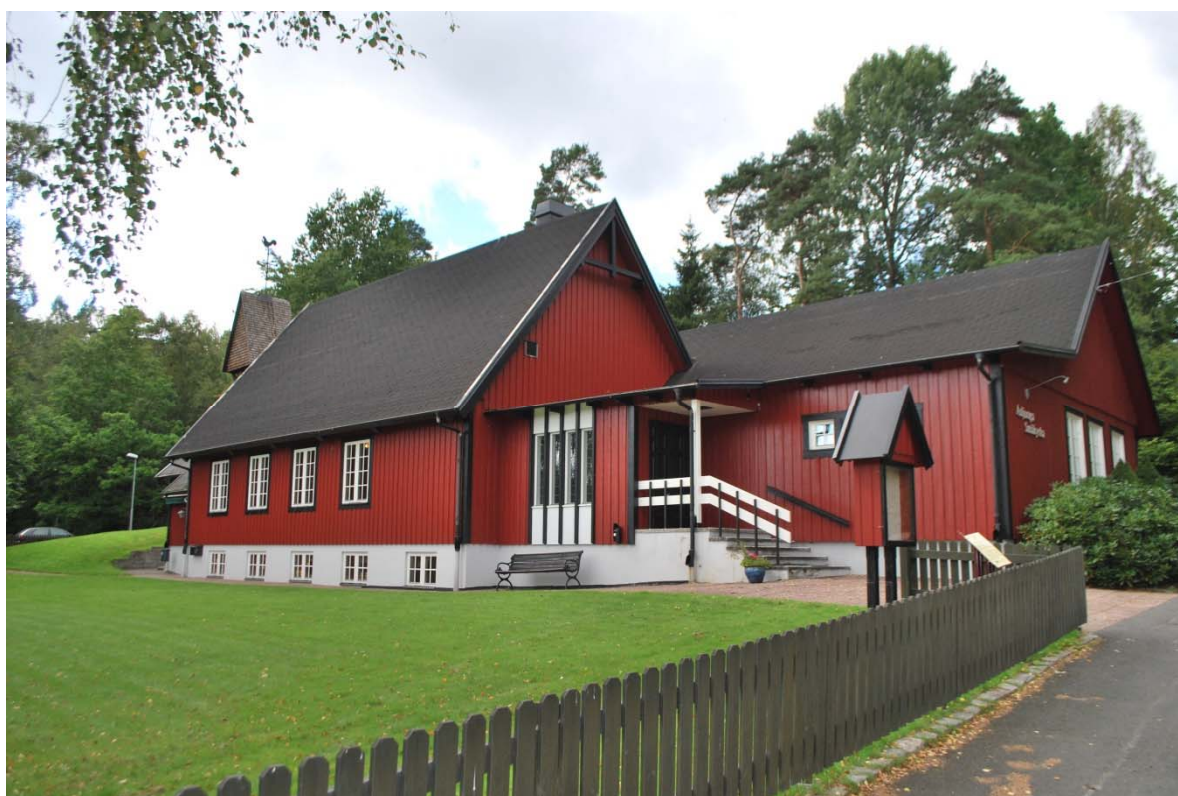
Fasad mot sydöst.