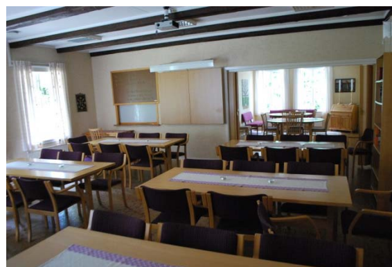
Samlingssal i gamla skolan.