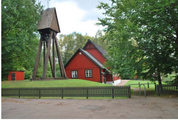
Fasad mot sydväst.