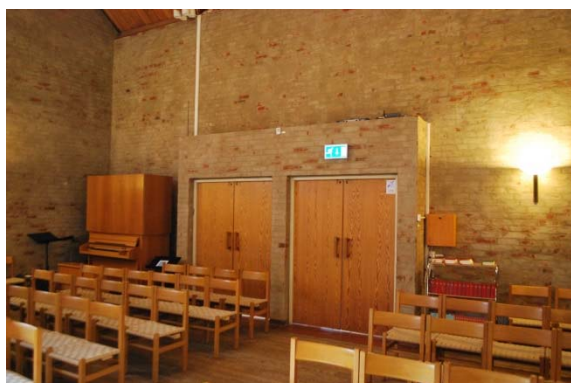
Kapellet mot entrén.