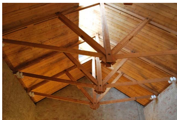
Taket i kapellet med ljus från taklanterninen.

Dagsljus kommer från den stora takkupan i väster vid nocken och två högsittande fönster på söderväggen varav det ena fönstret är dolt.