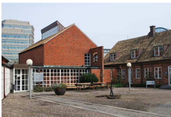
Fasad mot sydväst.

Östra längan, Våktaregården , är förmodligen ritad av Brunius på 1850-talet. Murarna är av handslaget tegel i gult och rött med flera nyanser. Skiftet är renässansförband med vartannat löpskift och koppskift. En utkragande putsad gesims i tre språng löper längs takfoten. Gaveln mot söder är en typisk Bruniusgavel med 13 trappstegstinnar