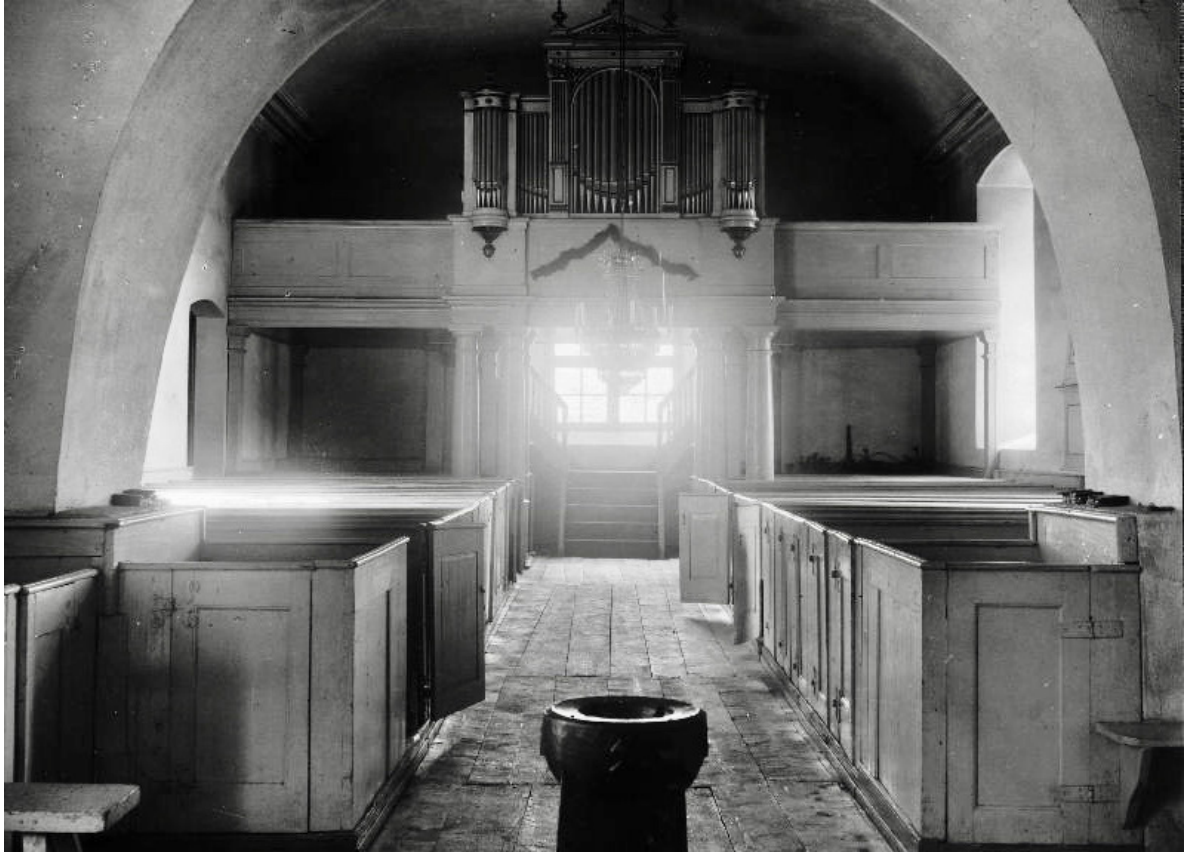
Långhuset fotograferat från koret 1915. Bänkinredningen har ännu inte fått sin ursprungliga färgsättning frilagd. Centralt syns dopfunten som beställdes året innan, 1914.

långs Kyrckan; och stohlställen, samt Beklädningen Kring väggarna, äfven i Choret, med tillhielp af det gamla, ånyo upprättades till 18 stohlstöd förmerade och med måhlning försedde. Detta alt på Kyrckans enskylta kåstnad, undantagne några få Dagevercken, them gårdfolcket uthgiorde, smat måhlningen, then Tyondegifvarna efter matlagen bekåstade. Tre år senare restaureras sakristian, vilket ännu manifesteras i norra gavelröstets ankarslutur som bildar årtalet 1781.