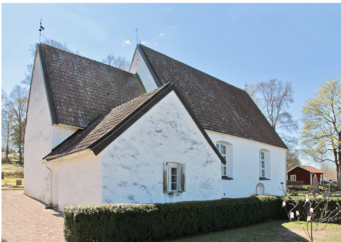
Kyrkan från nordöst med sakristian som uppfördes under medeltiden men senare byggts om.

2001 installeras jordvärmepump. 2009 inleds flera större arbeten, bland annat nytt ledningsnät för elanläggning, brand- och inbrottslarm, installation av intermittert värmesystem, ombyggnad av textilskåp, konservering av kyrkbänkar och renovering av lampkronor. 2012 genomförs en invändig restaurering under ledning av Ponnert Arkitekter AB, som möjligen var involverade även 2009. Arbetena omfattar framtagning av äldre trägolv, målningsarbeten, inrättande av ett mindre pentry i vapenhuset samt förnyelse av tekniska installationer.