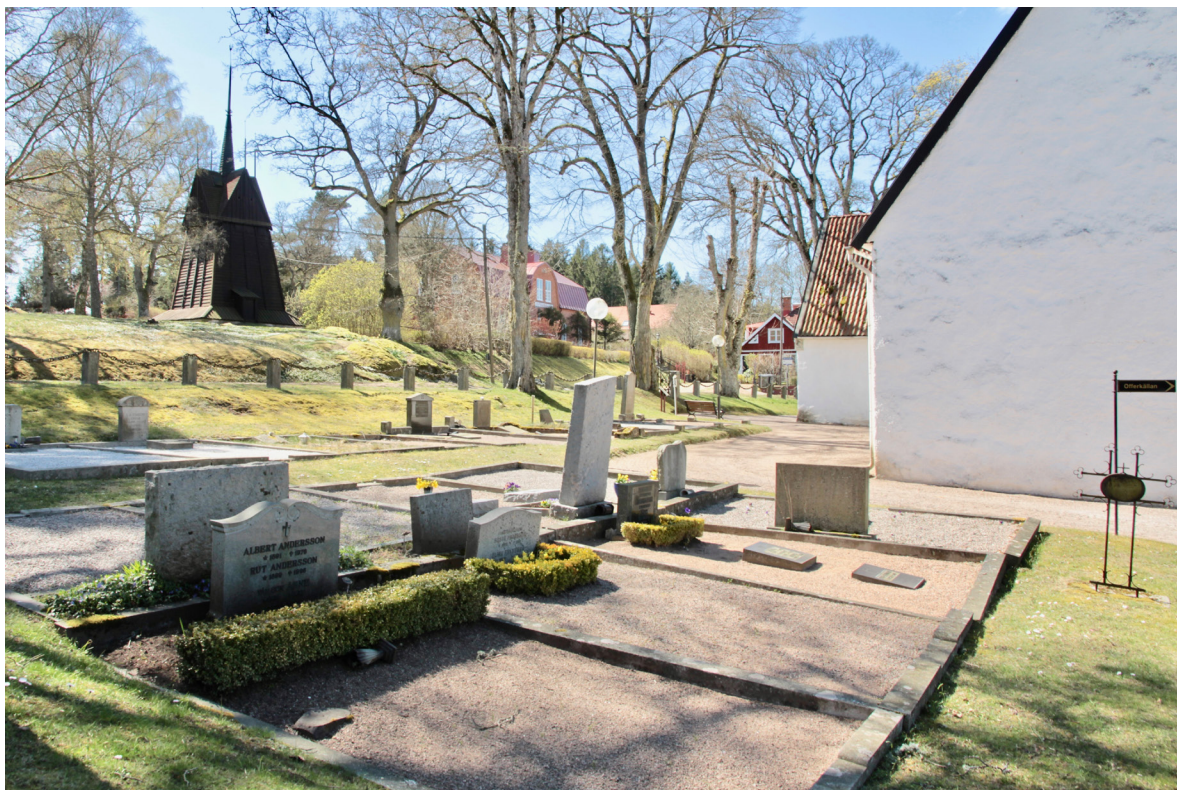
Öster om kyrkan är gravplatserna ännu grusade och omgärdas av stenramar. På andra sidan landsvägen står klockstapelns och höger därom skymtar före detta folkskolan och församlingshemmet.

öster om den väg som ännu skiljer de båda kyrkogårdsdelarna åt men som då ledde till den gamla bytomten i norr på andra sidan banvallen och ån. Den nya kyrkogårdens gångsystem fick en symmetrisk uppbyggnad strukturerad kring en central rundel. 1927 sker ytterligare en utvidgning åt öster genom att en mindre markyta som tidigare fungerat som skolträdgård inkorporeras i kyrkogården. Ett av luckhusen som flyttats hit redan 1899 kom på så vis att åter hamna på kyrkogården. 1939–40 uppförs ett bårhus efter ritningar av Tore Bälter. Vid mitten 1970-talet tillkommer gamla kyrkogårdens avgränsning med kedjor i pollare och kring samma tid anläggs ett kvarter för urngravar i nya kyrkogårdens sydöstra hörn. Minneslund anläggs på gamla kyrkogården under 1990-talet och 1995 byggs en ny ekonomibyggning vid parkeringen i väster. 2012 såldes Edestads församlingshem och 2015 rustades offerkällan upp. Vid inventeringen av kyrkoanläggningen i april 2020 pågick omgestaltning av nya kyrkogårdens centralt belägna rundel, bland annat genom resandet av ett skulpturalt verk i plåt.