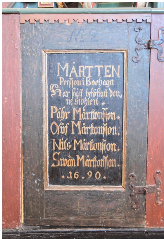
Detalj av bänkinredningen.