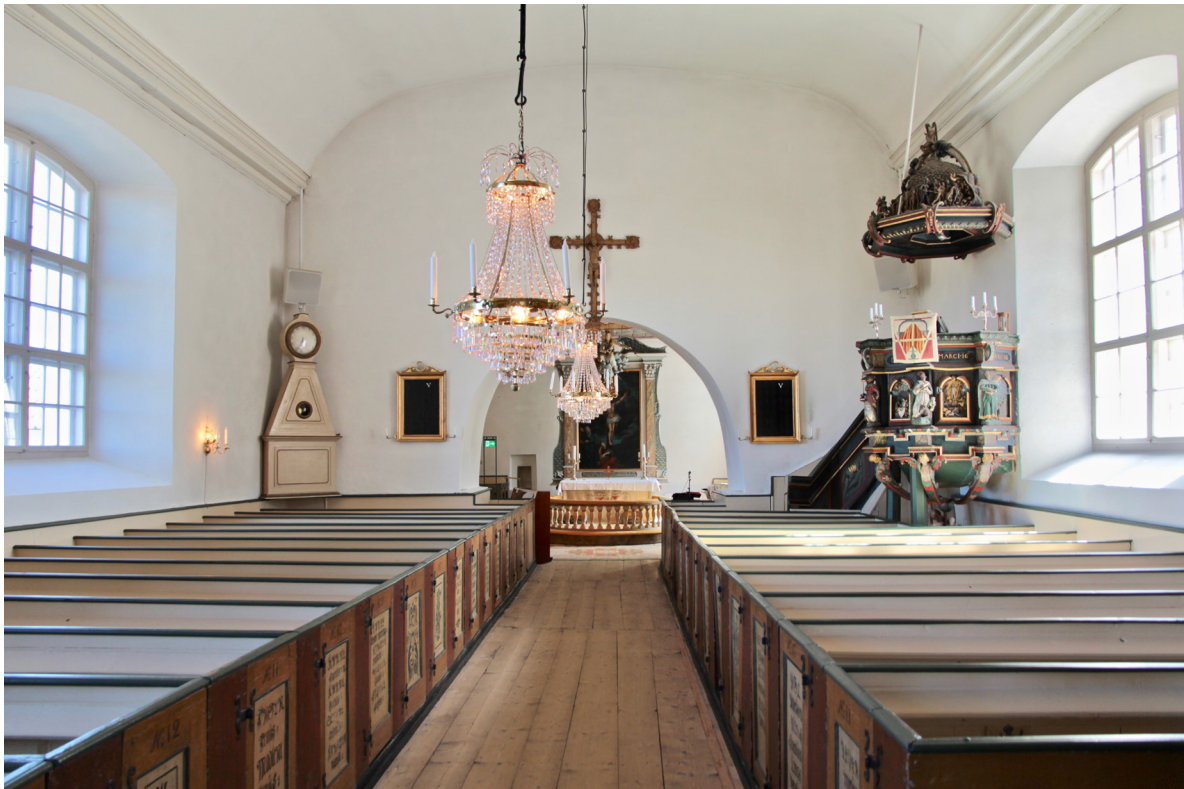
Kyrkorummet mot koret i öster.

Genom kyrkans huvudentré i söder nås vapenhuset vars golv är belagt med ett obehandlat furugolv. Den vitkalkade väggputsen följer murverkets ojämnheter och i östra muren finns en oregelbundet stickbågit nisch som pryds av fragmentariska kalkmålningar i röda kulörer. Ytterligare en stickbågit nisch, dock utan kalkmålningar, återfinns i norra muren öster om ingången till kyrkorummet. Sydvästra hörnet är inbyggt med väggar av stående gråmålad panel bakom vilka döljer sig lucka till vinden, teknikrum samt ett mindre pentry. Taket utgörs av vindsbjälklagets omålade golvbrädor på synligt bjälklag. Ytterportens insida är utformad likt utsidan och en identisk pardörr leder in mot kyrkorummet i norr. Dörrbladen är mot vapenhuset målade i brutet vitt medan de mot kyrkorummet ansluter till den fasta inredningen i gult, rött och blått. Vapenhuset är inrett med fast träbänk utmed västra och södra