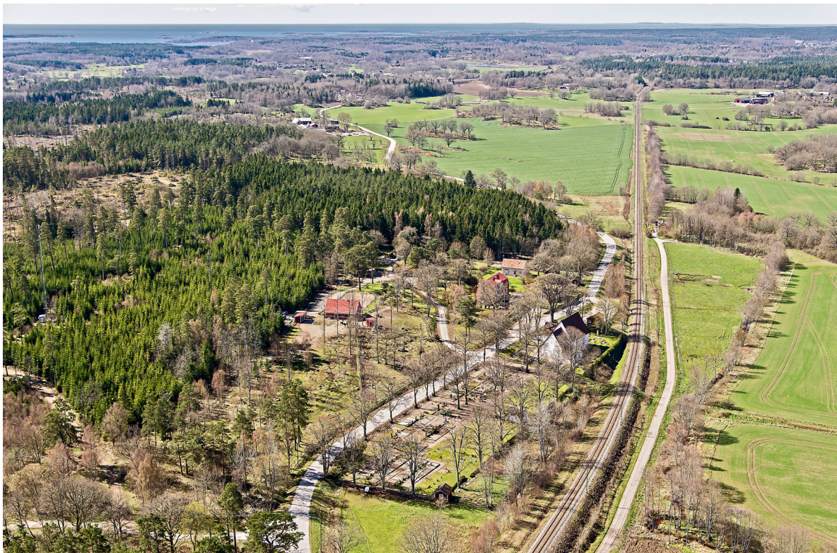
Flygbild över Edestad 2014, tagen från nordost.

Socknen sträcker sig i en smal sträng ner mot kusten men består till lejonparten av småbruten skogsmark som odlats upp kring Edestadsån. Av den gamla gårdstomten för