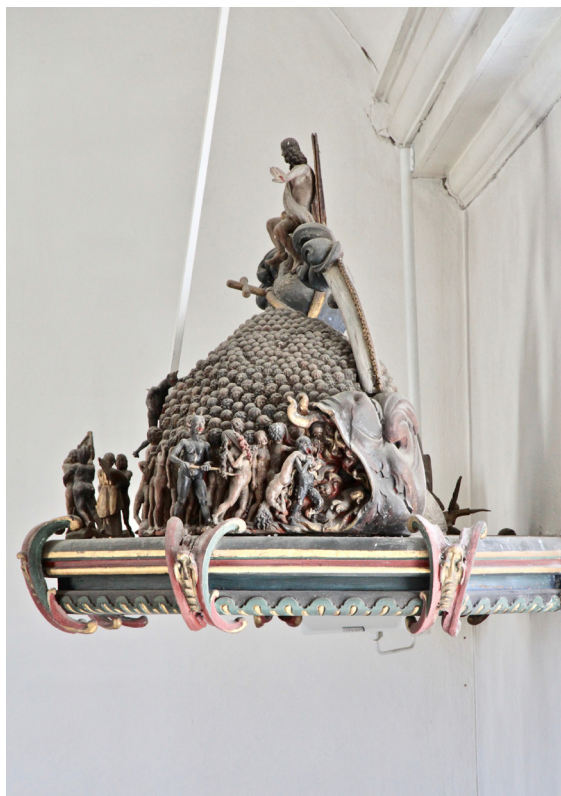
Den säregna baldakinen där Yttersta dommen framställs i skuren och snidad dekor.

sydportalen. På sakristians vind syns korets tidigare yttermur med bevarad puts och bemålad fris i rött triangulärt mönster. Takstolskonstruktionerna i ek har som tidigare nämnts dendrokronologiskt daterats till 1400- och 1500-tal och utgörs över långhus och kor av högresta saxsparrar som i långhusets kompletterats med förstärkning av furubrädor, sannolikt i samband med tillkomsten av tunnvalvet. Ryggåsen i koret har dekorationer vilket tyder på att takstolen varit öppen mot kyrkorummet. Takstolarna över vapenhus och kor har större inslag av bilad furu och visar dessutom spår på ombyggnader i form av äldre uttag. Bjälklagen och valvet är isolerade med lösull eller isolermattor.