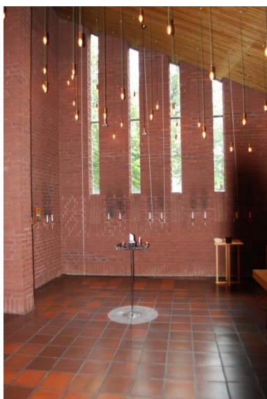
Kyrkorummet mot söder.