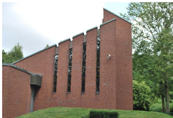
Kyrkan mot söder.