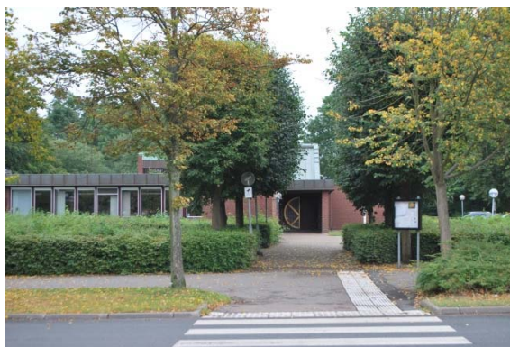
Entré från väster.