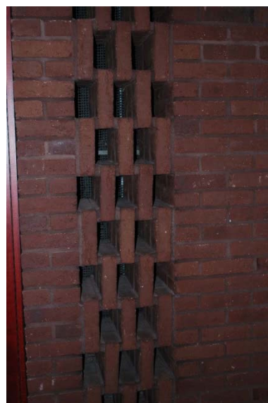
Ventilation i kyrkorummet.

Sakristian intill kyrkorummet har väggar, tak och golv lika kyrkan. I en vägg finns en