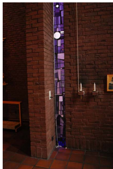
Glasmosaikfönster av Tom Möller.