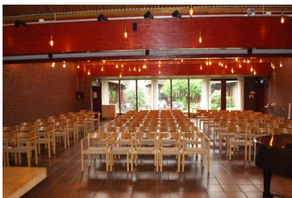
Kyrkorummet från altaret mot väster.

flankeras av två smala fönster från golv till tak med glasmålningar i lila toner. Tegelstenarna vid sidan om glasfönstret är i vartannat skift något vinklade. På väggarna finns ljuslampetter bestående av en utskjutande tegelsten med en ljushållare. De sitter i par med ett inristat konsekrationsskors i stenen ovanför. De tolv ljusparen ska symbolisera de tolv apostlarna. I taket hänger en mängd nedpendlade lampor bestående av glödlampor som hänger på olika höjder, dessa ska minna om de tungor av eld, som den första Pingstdagen föll över den kristna församlingen. Den tidigare orgeln var placerad mot norrväggen, där ett träraster ersätter tegelväggen. Tekniken är integrerad och dold. Värmen är genom galler i golvet längs väggarna. Ventilationen är genom öppningar i tegelväggen. Rummet delas av en kraftig balk i taket av rödbetsat limträ. De båda pulpettaken möts vid balken i sina lägsta punkter. Västväggen i kyrkorummet har fönster ut mot atriumgården och fönster uppe vid taket.