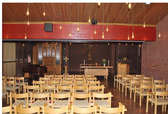
Kyrkorummet mot altaret i öster.