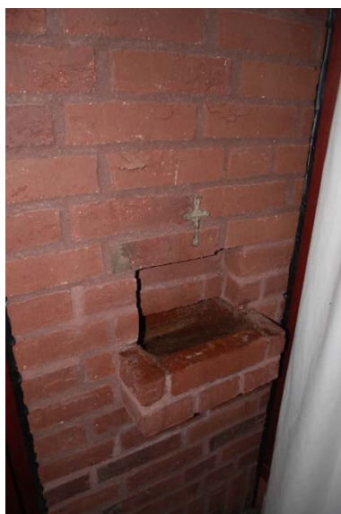
Piscina i sakristian.