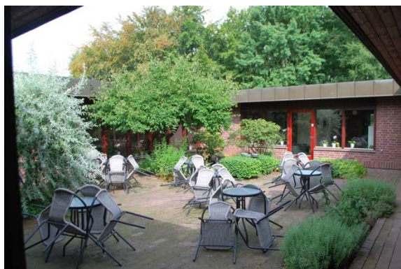
Atriumgården i mitten av anläggningen.

Ett tillbyggt stort förråd finns på baksidan, östra sidan, av anläggningen. Förrådet har väggar av svartputsade lecablock och ett svagt lutande pulpettak med svart papp och takavvattning av svart plåt.