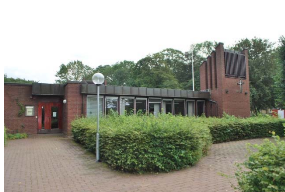
Arbetsrum mot väster.