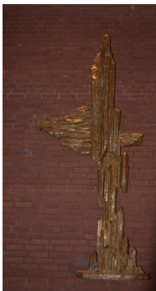
Kors av Folke Truedsson.