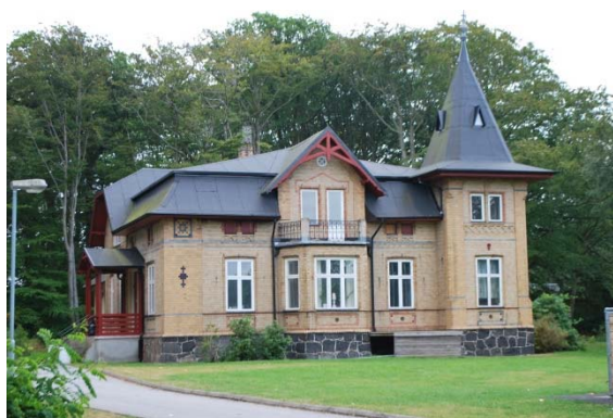
Gården Adolfsberg, nu fritidsgård, granne med kyrkan.