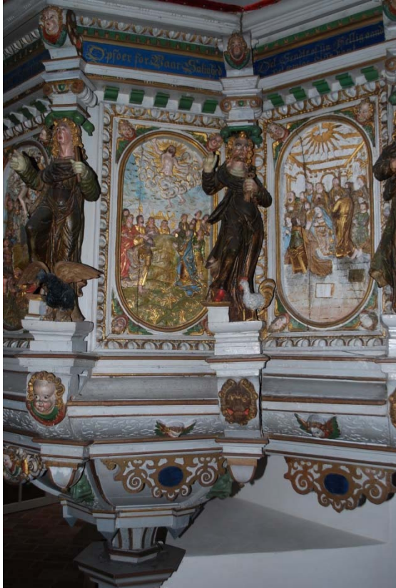
Detalj av predikstol.