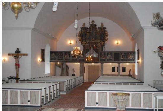
Långhuset mot väster från koret.

Koret med grå klinkerplattor ligger lite högre än övriga kyrkorummet. Högkoret, beläget i absiden, med golv av svarta och vita viktoria­plattor ligger ytterligare två steg högre. Närmast altaret finns en halvcirkulär upphöjning. En profilerad gesims delar korets tunnvalv från absidens hjälmvalv. I absidens östra del har en sakristia avdelats med två skärmväggar i vinkel mot altaret. Skärmväggarna har kvadratiska marmoreringsmålade fyllningar och profilerad sockel och krönlist. I väggarnas