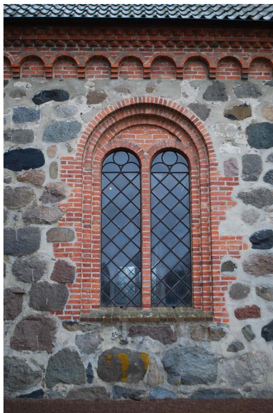
Gjutjärnsfönster med tegelomfattning. Rundbågefris.

Tornet har en gördelgesims ovanför första våningen av samma typ som takgesimsen på långhuset. På andra våningen finns en urtavla mot väster, runda fönster mot norr och söder. På tredje våningen, klockvåningen, finns tegelomfattade dubblerade ljudöppningar i alla väderstreck. Ovanför ljudöppningarna finns en tegelmurad bred takgesims bestående av rundbågefris. Tornets fyra gavelrösten i alla väderstreck är tegelmurade med rundbågefris och olika blinderingar.