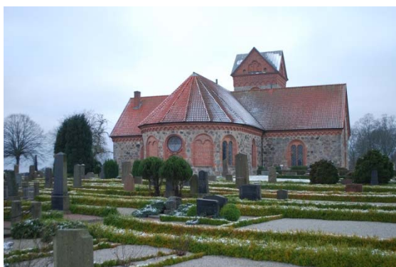
Kyrkan från öster. Kyrkogård med buxbom och singel.

En container med plats för maskiner och en förrådsbyggnad av grön träpanel och valmat papptak står i kyrkogårdens södra gräns. En hög metallbehållare för pellets till kyrkans värmepanna står utanför häcken söder om kyrkan.