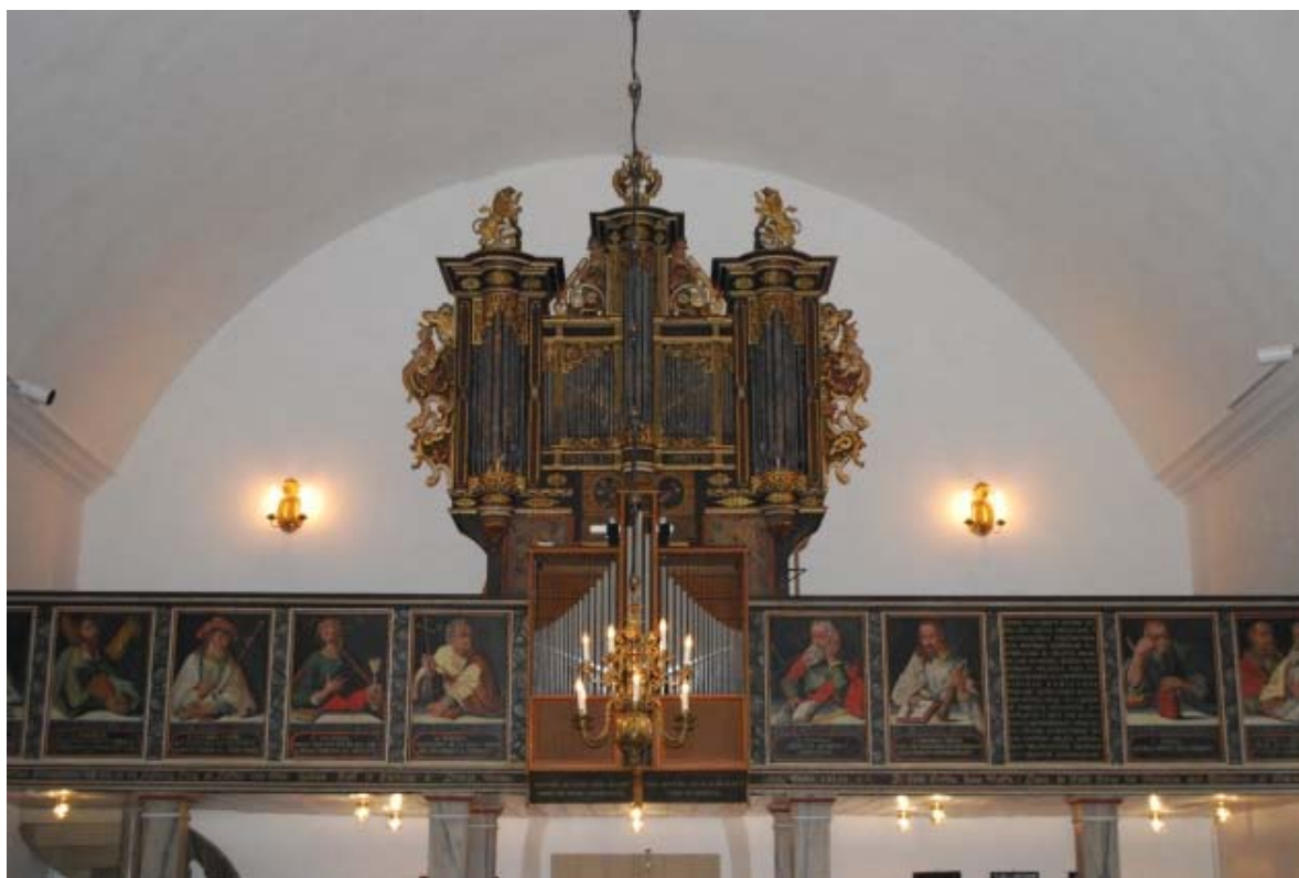
Orgel och läktarbarriär.