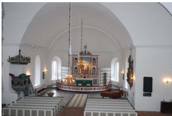
Långhuset mot altaret från orgelläktaren.

Orgelläktaren bärs av sex kvadratiska marmoreringsmålade pelare. Läktaren och orgeln kommer ursprungligen från S:ta Maria kyrkan i Helsingborg men är ombyggda. En grå spiraltrappa, med räcke av marmoreringsmålade figursågade brä­dor, leder upp till läktaren som har svart trägolv. Läktarbarriären beskrivs under inventarier. Under läktaren förvaras luckor med renässansmålning som ingått i orgeln.