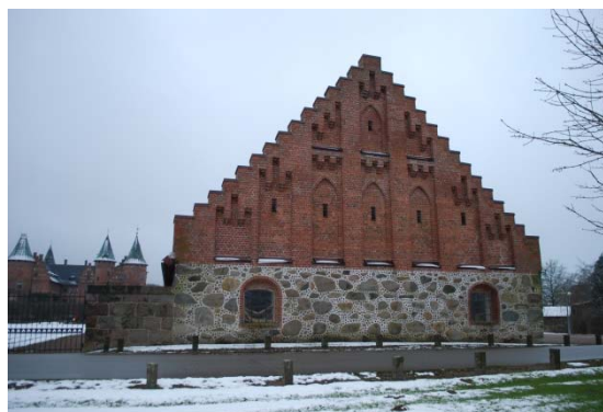
Ekonomibyggnaderna på Trolleholm ritade av Brunius.