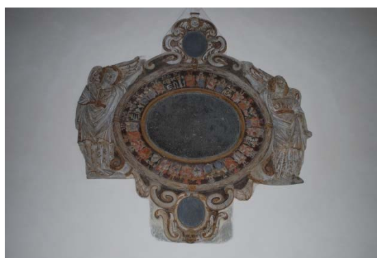
Epitafium i kalksten från 1666 uppsatt över Ove Thott.

Tornets bottenvåning är vapenhus, andra våningen är tornkammare med putsade och vitkalkade väggar och brädgolv, tredje våningen är klockvåning med väggar av oputsat gråstensmurverk och brädgolv. En I-balk längs muren är inlagd för att stötta rötskadat upplag. Klockstolen är av bilad fur och ek, flera urtag i timret tyder på att vissa delar är återanvända. Tornvinden är delvis öppen mot klockvåningen och nås med fasta stegar. Gavelröstena är murade i rött tegel, två av dem är putsade.