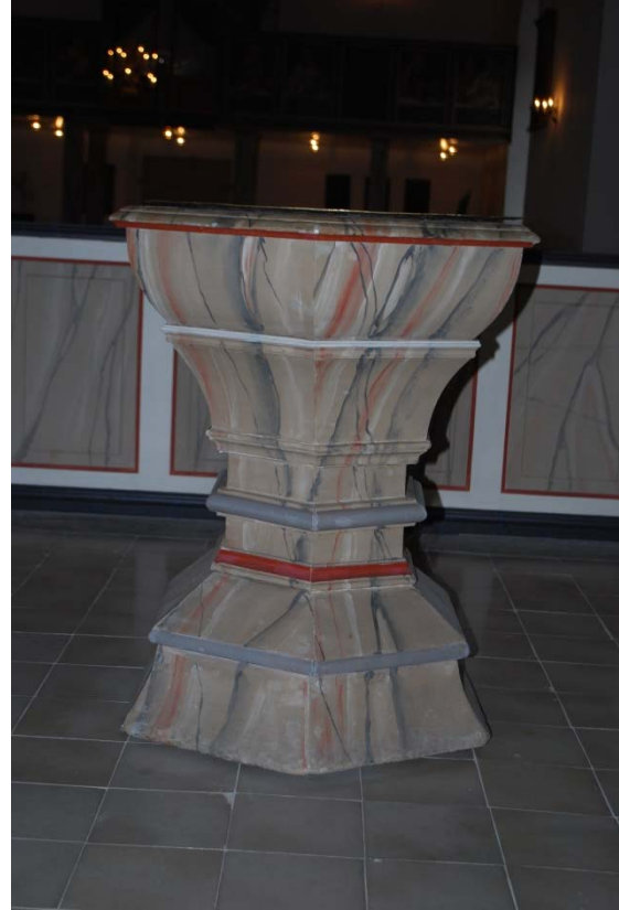
Dopfunt i trä från 1700-talet