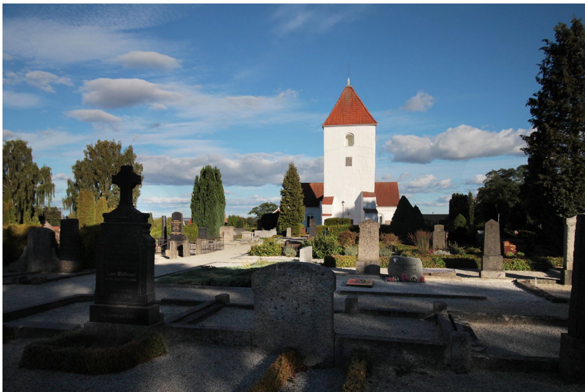
Den gamla kyrkogården.

Den gamla kyrkogården omgärdas av en hagtornshäck och har järngrindsförsedda ingångar från söder, norr och öster. Kyrkogården ligger någon meter högre än Byvägen som slingrar sig runt kyrkogårdens norra och östra delar. Den östra ingången är