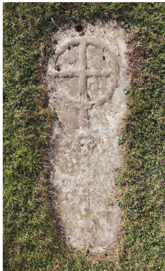
Den förmodade romanska gravstenen framför långhusets södra sida.

Strax utanför kyrkogårdens sydvästra hörn finns den gamla bystenen bevarad, den så kallade "stämestenen". I äldre tider samlades byamännen vid stenen för viktiga överläggningar.