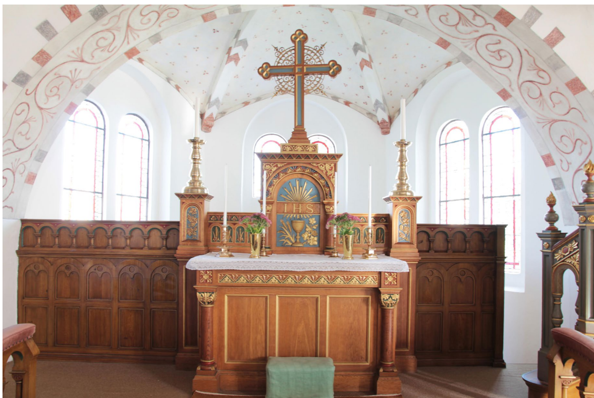
Altaranordningen ritades av Henrik Sjöström och tillverkades i ek av snickaren Nils Wanngren år 1900.

Altarringen är halvcirkelformad och tillkom samtidigt som altaret och altaruppsatsen och ritades av Henrik Sjöström. Skranket består av en rundbågig kolonnettrad med tärningskapitäl.