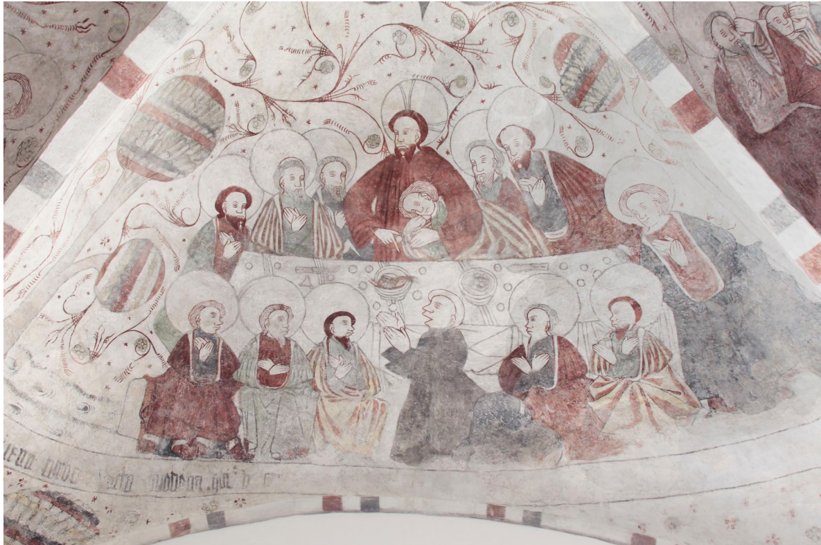
Målningarna rengjordes och konserverades vintern-våren 2015 av Skånes målerikonservatorer. I det östra valvets södra kapp skildras den sista måltiden.

är vitputsade. Den spetsbågiga tornbågen finns bevarad mot långhuset men är igenmurad. Kyrkorummet nås via en pardörr i ek från 1955.