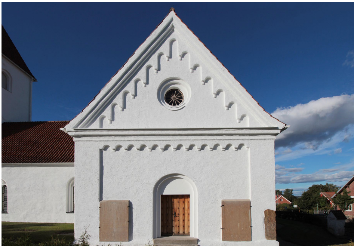
Två gravhällar som tidigare legat inne i kyrkan står uppställda mot den södra korsarmens gavelfasad. I det östra hörnet finns en av de tre runstenarna inmurad. Dörren ritades av domkyrkoarkitekten Eiler Græbe 1955.