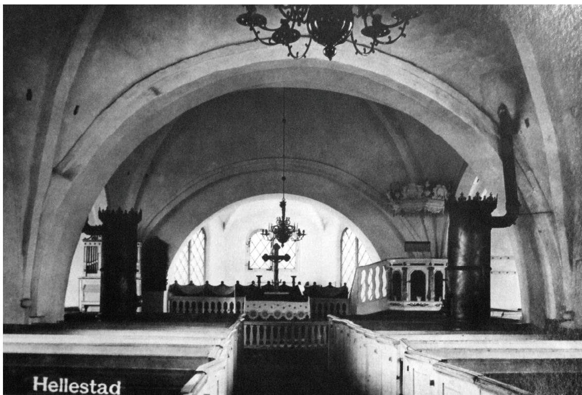
Hällestad kyrkan före 1900. Målningarna var ännu överkalkade och kyrkorummet värmdes upp av två stora järnkaminer. Bänkinredningen bestod av slutna kvarter och mot sakristian fanns lågt skrank.

väster som vilade på pelare. I kyrkan fanns en målning, föreställande en prost med hustru. Vidare beskrevs rester av de medeltida målningarna. På hörnet mellan långhuset och koret fanns en bild av Johannes Döparen. Öster om långhusets norra fönster syntes bilder av knektar med lansar och spjut, och på andra sidan fönstret "fruntimmersbilder".