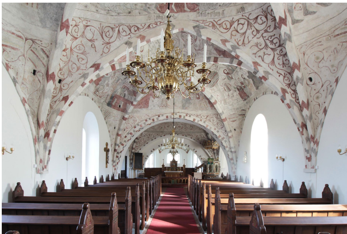
Kyrkorummet sett åt öster.

Kyrkans huvudentré återfinns i tornets västra mur. Den kopparbeslagna ekporten tillkom 1955 och formgavs av dåvarande domkyrkoarkitekt Eiler Græbe. Porten leder in till det valvslagna vapenhuset. Golvet består av rött handslaget tegel och väggarna