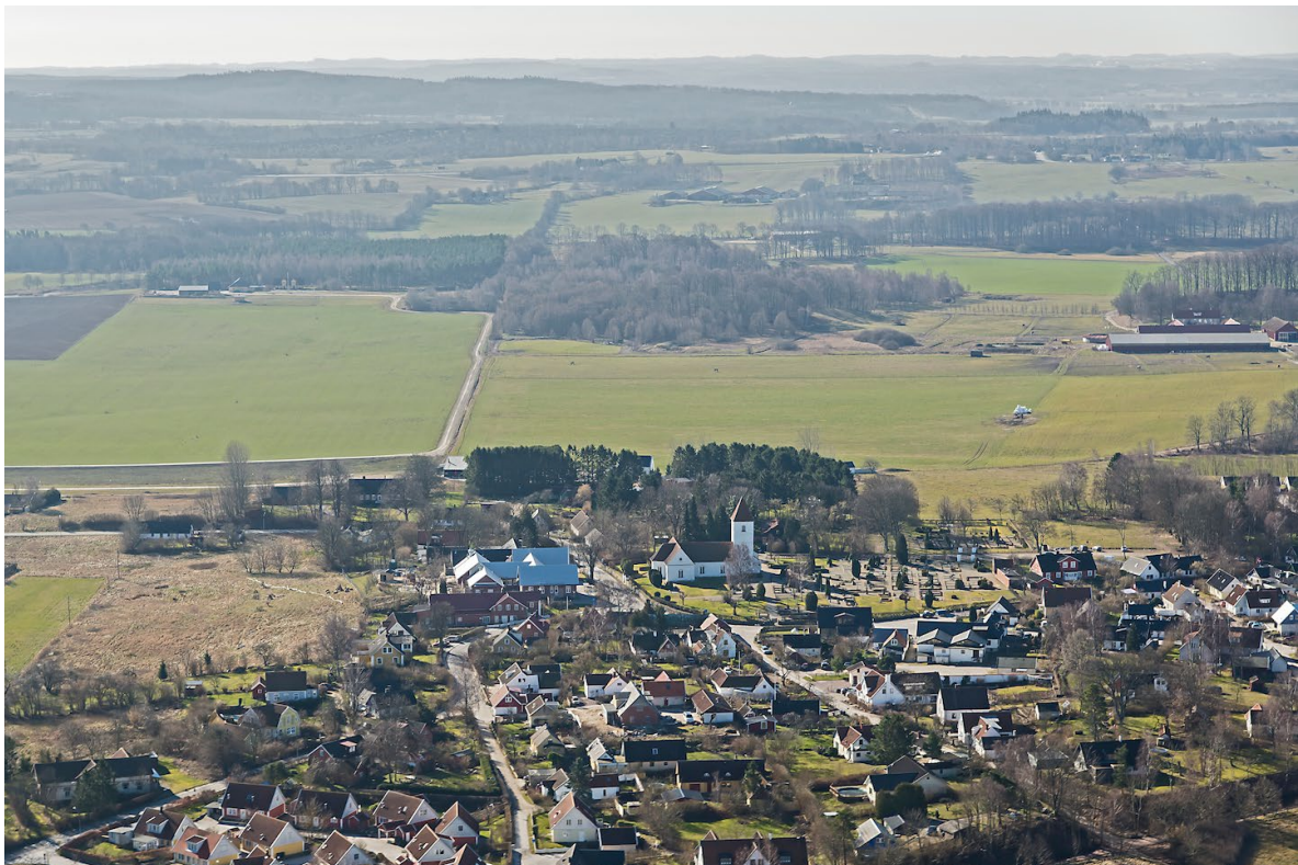
Flygbild över Hällestad by tagen från norr, 2014. I bakgrunden syns Romeleåsen.

Torna Hällestad ligger omkring 1,5 mil sydost om Lund, några kilometer öster om Dalby. Byn är placerad på Romeleåsens nordostsluttning och avlöses av det militära övningsfältet Revingehed som breder ut sig öster om byn. Området kännetecknas av en blandning av slättlandskap med åkrar och betesmark, skog och åsar. Den som anländer till byn från öster passerar genom den så kallade Paradisporten, en bokskogsbevuxen dalgång som skurits genom en av de många rullstensåsarna som finns i området. Till vänster efter åsen ligger Kaninlandet, ett öppet sandfält, vilket är boplats för flertalet sällsynta djur- och växtarter. Till höger ligger fotbollsföreningen THIF, en samlingsplats för många av byns unga. Byn gränsar i norr mot naturreservatet Gryteskog. I naturreservatet finns vad som förmodas vara Europas största bestånd av