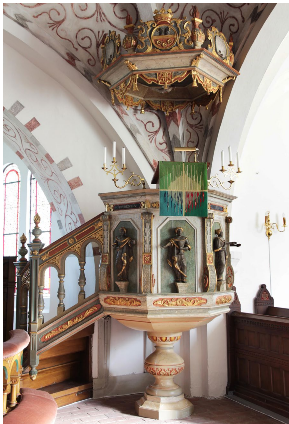
Predikstolen tillverkades 1752 av Johan Ullberg.

Även mittvalvet och sakristians valv är dekorerade med kalkmålningar. Motiven som hämtats från de medeltida målningarna är komponerade av domkyrkoarkitekten Theodor Wählin och tillkom 1914. Den norra korsarmen är belägen ett par trappsteg högre än det övriga kyrkorummet och delas av från korsmitten med ett lågt skrank i stil med altarringen. Här finns kyrkans orgel med fasad från 1903. Den södra korsarmen var tidigare fylld av bänkar, men gjordes om till barnhörna i början av 2000-talet. Sakristian finns inrymd bakom skranket som består av altaruppsatsens förlängning åt norr och söder.